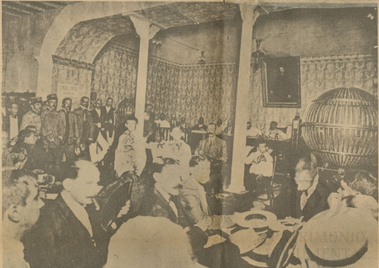
Aspecto de la sala en el viejo edificio de la Intendencia de Hacienda, en la mañana del día en que se efectuó el primer sorteo de la Lotería Nacional.