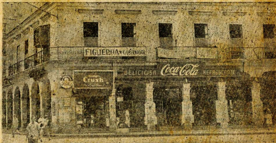
"Marte y Belona"... A fuerza de verle desde los primeros pasos por la vida, le queríamos. Ahora, será demolido para alzar un moderno edificio que comenzará otra historia, pero menos gloriosa que la alcanzada por la esquina de Monte y Amistad desde más de un siglo de existencia popular...

Porque así es la vida. Esa es la vida. Esta es la vida, "Marte y Belona". —¡Adiós...! ¡Adiós...!