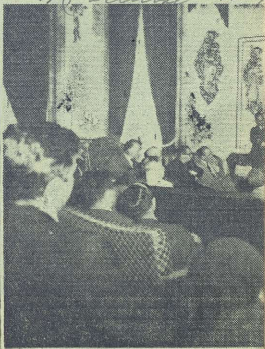
Roja con el Cuer

Francia, pues el asunto para el cosmonauta ren grandes esfuerzos y inmediato. Afirmó que si la tica, Estados U