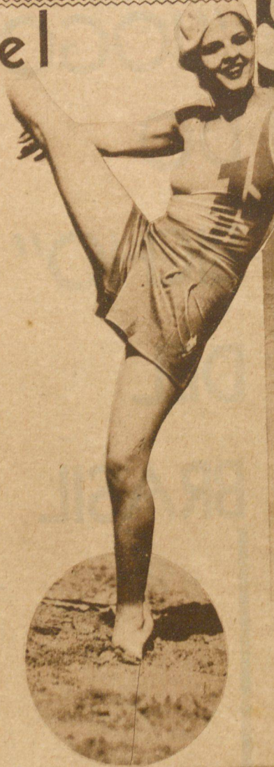
Lilian Bond, la maravillosa actriz de la M. G. M. cuando se encuentra en la playa, pone de manifiesto sus cualidades artísticas de una manera evidente. En esta foto se puede apreciar un original aspecto de su cuerpo de diosa cubierto con una original y elegante trusa "Catalina"