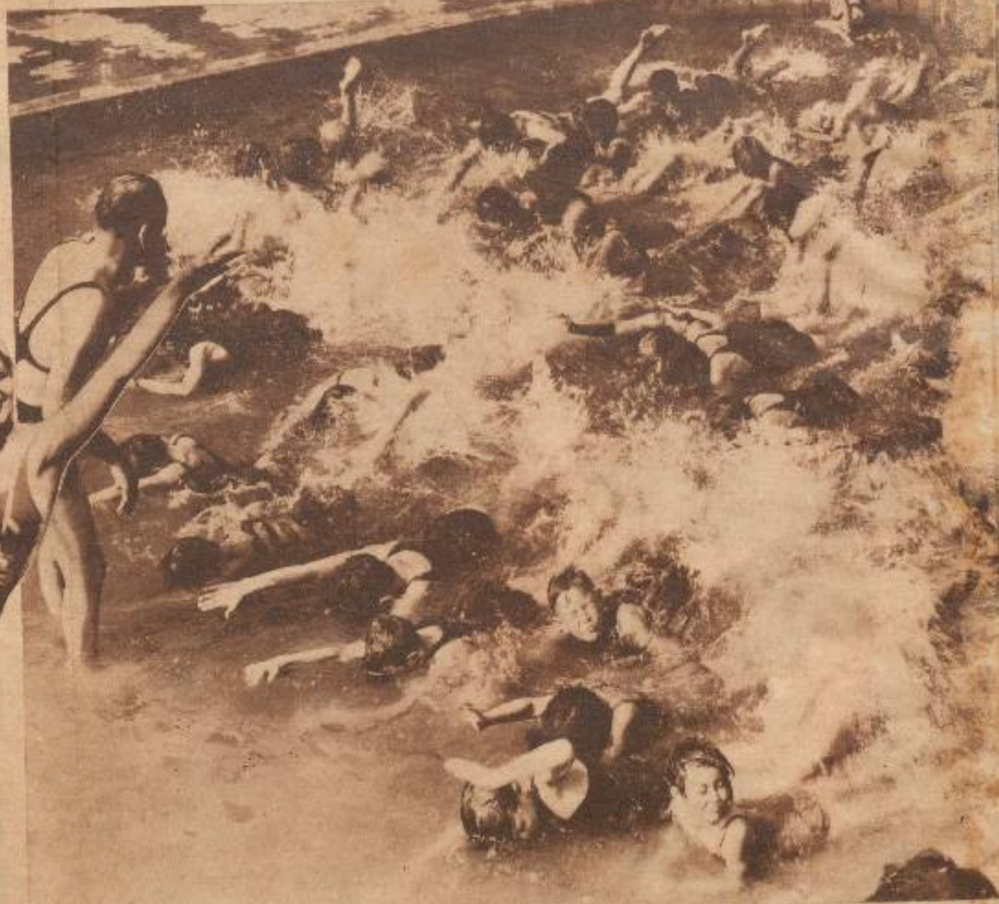
Lillian Bond, la maravillosa actriz de la M. G. M. cuando se encuentra en la playa, como de manifiesto sus cualidades artísticas de una manera evidente. En esta foto se puede apreciar un original aspecto de su cuerpo de diosa cubierto con una original y elegante trusa "Catalina"

Las arenas de la playa, se hicieron para ser pisadas por todo el mundo. Donde pisa la planta del pie una persona de rancia aristocracia, puede ponerla, al mismo tiempo, una de ascendencia plebeya, y una huella grabada en la arena por un banquero opulento, puede ser borrada inmediatamente por los pies de un criminal. En esta foto se puede apreciar al famoso pistolero norteamericano Jack Mc Guin ("Ametralladora"), tomando un baño de sol en una playa de la Florida en compañía de su "brida", la rubia Albia, mientras la policía norteamericana lo buscaba por todo el país