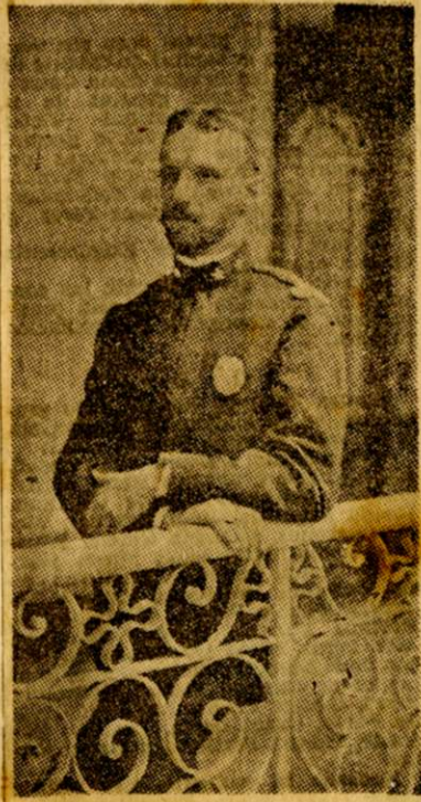
General Mario G. Menocal.