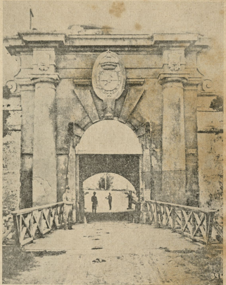
Portada de la Fortaleza de la Cabaña. Arq. Militar del siglo XVIII.

Concretando diremos que en 1773 faltaba poco para terminar la fachada de la Casa de Correos, más tarde la Intendencia, y tratando de imitarla como es sabido se empezaron las obras del Palacio de los Gobernadores o Casa de Gobierno en 1776, después de aprobarse el proyecto por real cédula en 1774, quedando la imitación con su personalidad muy superior al modelo; y que por esos mismos años del 1774 al 1780 se construyó por los mismos autores la fachada de la Catedral, la cual fué inaugurada por el Obispo Trespalacios en 1789. Las similitudes existentes entre las tres obras máximas de nuestra arquitectura Colonial, comprueban lo anterior.