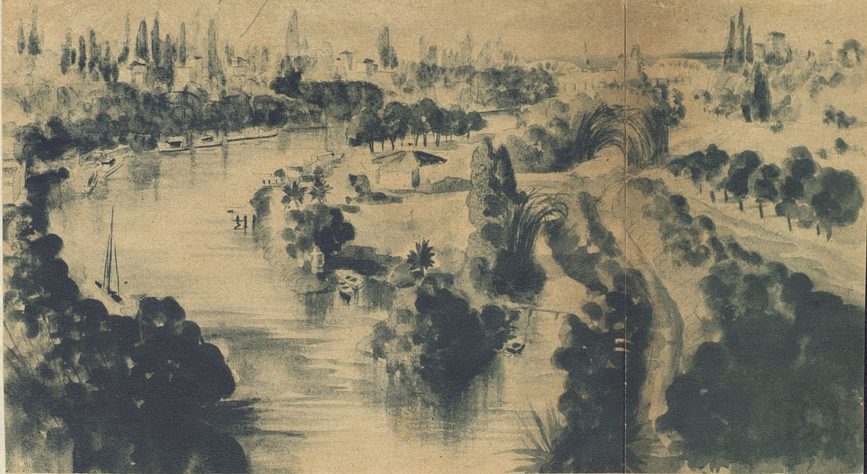
Bella perspectiva de lo que será el Bosque en el primer sector, esto es, entre puentes, vista desde el Puerto Habana, en la calle 23.