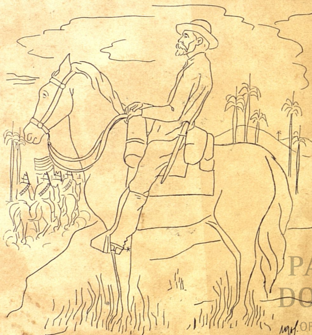
Máximo Gómez en 1895, por Rigol.

These observations are based on a study of Winston Churchill's book, "A Roving Commission", and the recently published War Diary of General Gomez.—Ed.