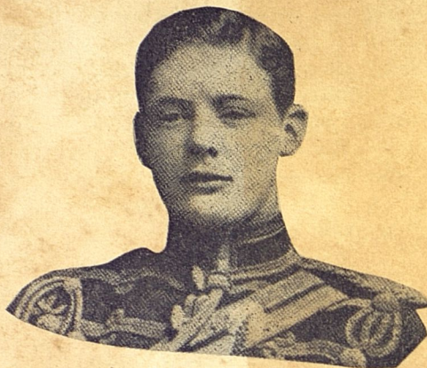
Winston Churchill en 1895

Martínez Campos, el mejor general español de aquella época, fracasaba ante la famosa contramarcha estratégica de Gómez en las provincias de Matanzas y Santa Clara. Las modalidades combativas de Gómez no eran comprendidas por 42 generales españoles al mando de 250.000 soldados. Faltaba un Zumalacárregui, o un Mina, o un Merino, o un Viriato, para que la auténtica gloria ibérica de todos los tiempos surgiera en ese guerrillerismo único, creado por características raciales y ambientales.