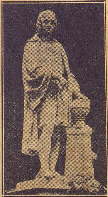
Estátua de Cristóbal Colón