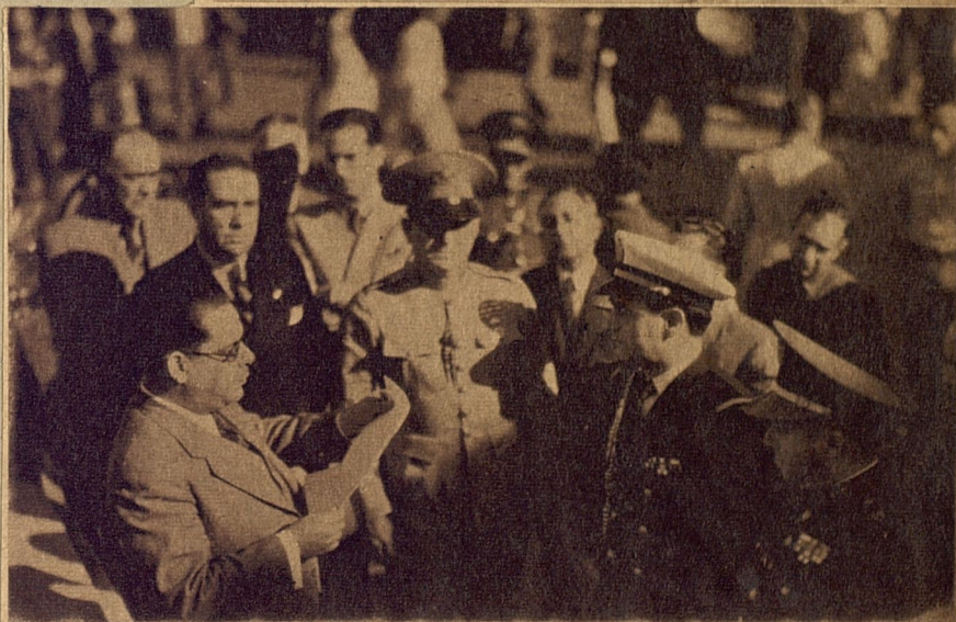
EN EL ANTIGUO Paradero de Garcini se develó una cartela de bronce— uno de los actos celebrados para conmemorar el Centenario de los FF. CC.—en que se lee: «El 19 de noviembre de 1837 hizo su viaje inicial desde la Casa de Parada de Garcini, que se levantaba en estos terrenos, hasta la ciudad de Bejucal, el Primer Ferrocarril de Cuba, de la Habana a Güines, establecido por la Junta de Fomento, a iniciativa de la Sociedad Económica de Amigos del País. Para rememorar el centenario de esa efemérides fué colocada por el Municipio de La Habana la presente lápida, el 19 de noviembre de 1937». Estas dos fotos registran el significativo momento: en una, aparece la aludida tarja, y en la otra: el representante del Alcalde habanero, leyendo unas cuartillas alusivas al acto