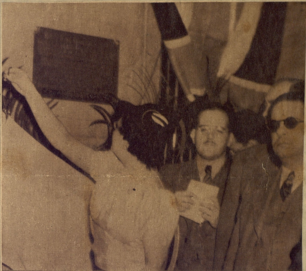
EL CENTENARIO del Ferrocarril.—Con gran brillantez se celebraron ayer en la Habana y Bejucal los actos conmemorativos del centenario del ferrocarril en Cuba. Ofrecemos en esta fotografía, de izquierda a derecha, un aspecto del develamiento de una tarja en la Estación Terminal. Al centro, el Subsecretario de Co-

municaciones haciendo uso de la palabra durante el acto celebrado en ese Departamento, y finalmente, el propio señor Subsecretario en unión del señor Ministro del Brasil, depositando el primer sobre franqueado con un sello conmemorativo