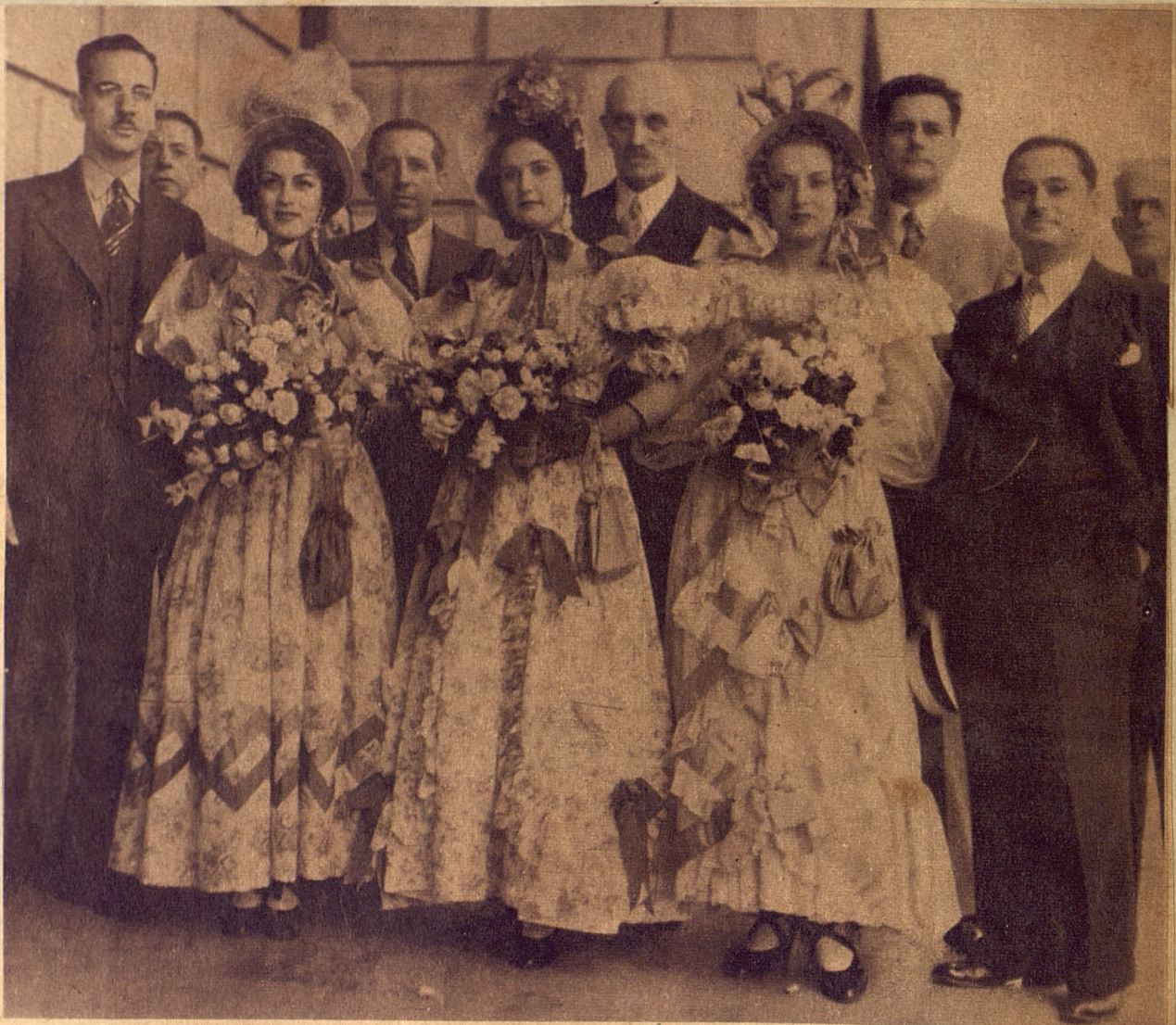
A LOS DISTINTOS actos llevados a cabo ayer para conmemorar el centenario del Ferrocarril en Cuba, asistieron las reinas de la Habana y Bejucal tocadas de guisa espléndida, a la manera de 1837. En nuestra foto: Miss Habana, momentos antes de partir—en