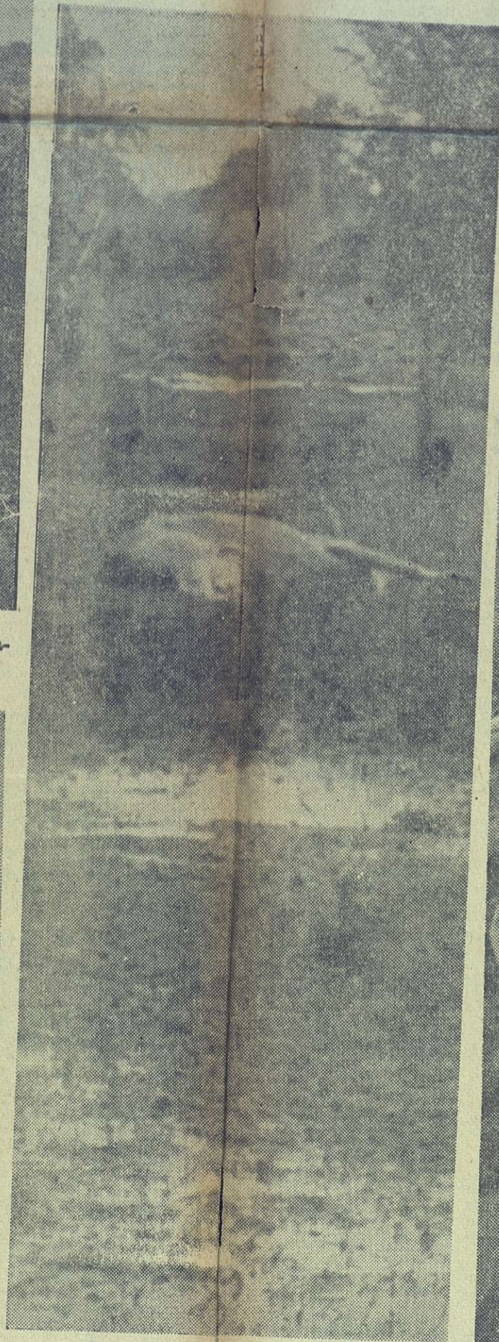
Esta res muerta es una de las tantas que se pueden ver en las diferentes zonas por las que pasó el ciclón.