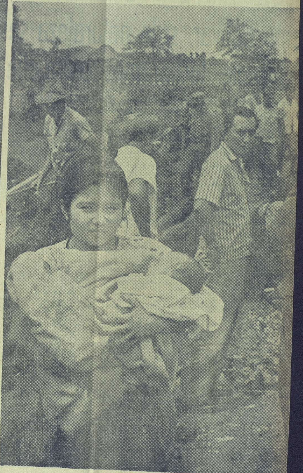
Con los niños en sus brazos, esta madre se dispone a regresar a su hogar después de haber pasado incontables horas de angustia.