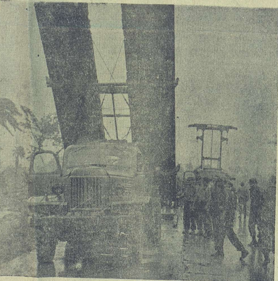
Camiones adaptados en los que se transportan los puentes portátiles.