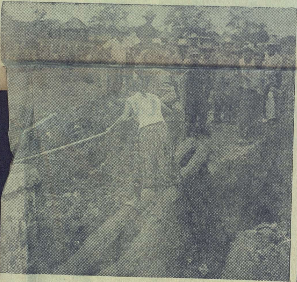
La gente que iba para Holguín y otros lugares de la provincia, tenían que hacerlo a pie, cruzando puentes de árboles improvisados al efecto.