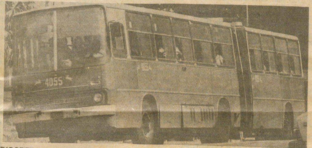
DISCRETOS resultados en el aumento de viajes en terminales incorporadas a este sistema.

en el buen servicio. Se están remodelando aceleradamente 10 de las 22 terminales capitalinas; se ha incrementado la protección e higiene en todas las áreas, la atención directa a la alimentación y se está respondiendo a las necesidades de uniforme.