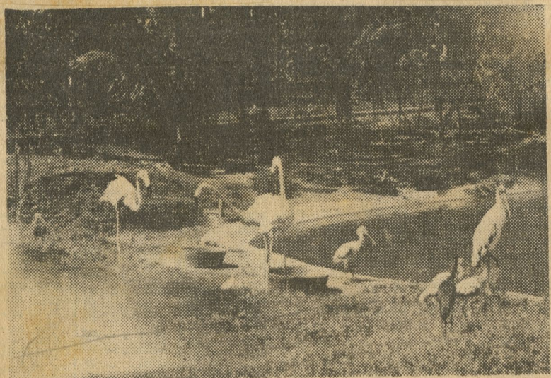
El gran estanque para aves acuáticas que ocupa el frente norte del Parque, junto a la Calzada de Almendares.