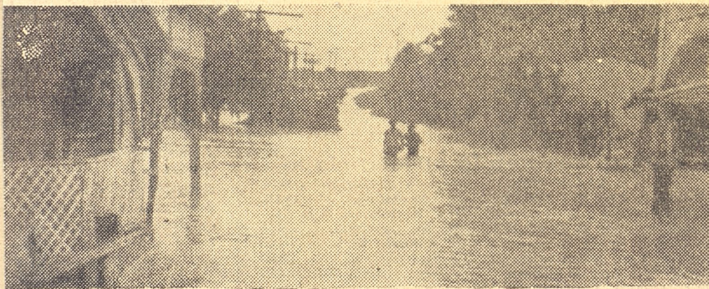
Las aguas crecidas del río Guaso, en Guantánamo, inundaron las calles del barrio San Justo y las viviendas ubicadas a las márgenes del propio río. En total nueve casas fueron arrasadas.

La furia de los vientos del ciclón "Flora" a su paso por la región de Guantánamo, causó extraordinarios daños en las zonas agrícolas donde las siembras de frutos menores y cosechas han sido prácticamente arrasadas. Las Granjas del Pueblo, Asociaciones Campesinas, Sociedades Agropecuarias y Fincas Estatales, han sufrido incalculables pérdidas en cientos de caballerías cultivadas de plátanos, yuca, boniato, calabaza, con la destrucción total del plan horticola que se estaba llevando a cabo con vistas a la producción de frío. Desde las Granjas Cañeras también se han reportado considerables pérdidas en la siembra de cañas, mientras por otro lado se reciben informes sobre la merma en la producción de la cosecha de café.