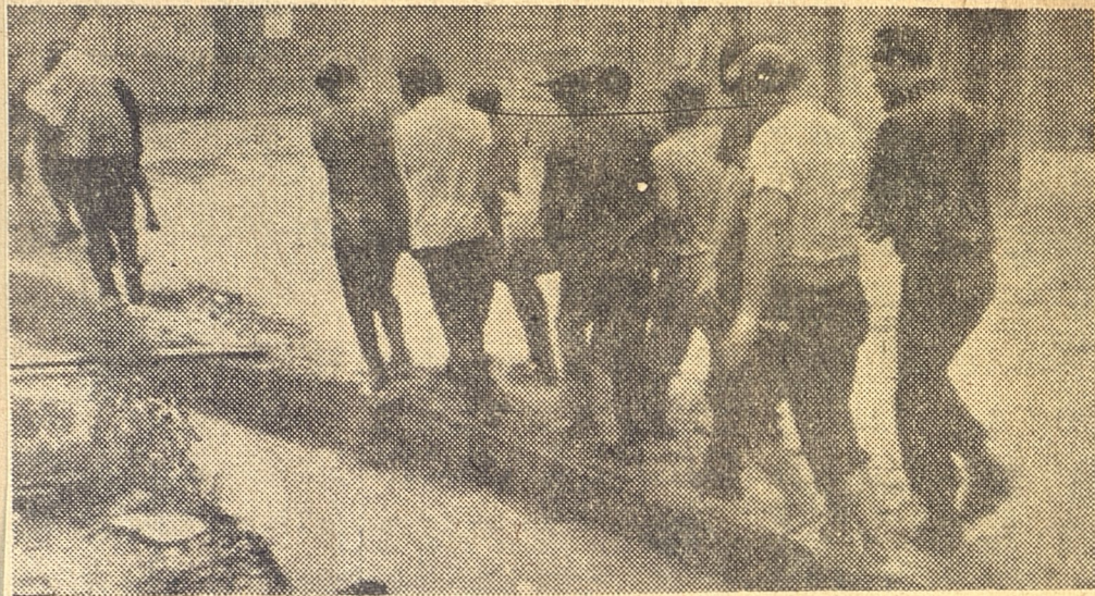
Compañeros milicianos, miembros de la UJC y bomberos conducen a una señora enferma.