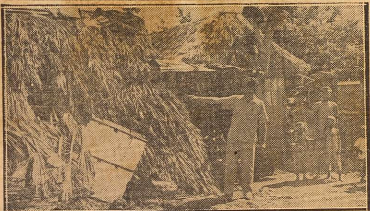
Los campesinos sufren agua, viento y sol. Desde hace nueve meses no trabajan. La enfermedad y el hambre los destroza... ¿Sabe esto el Presidente Grau...?