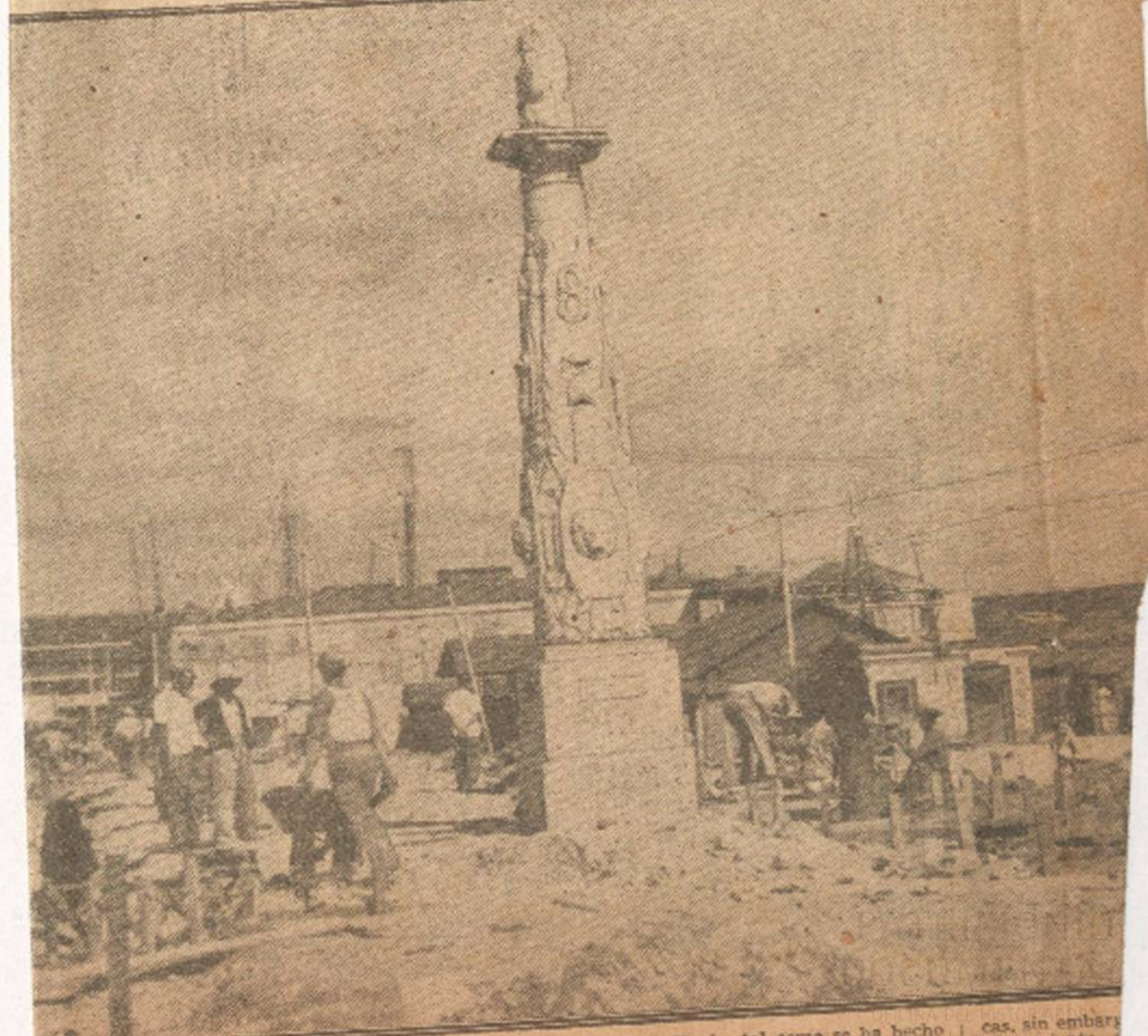
ere por la González Na... meda de Paula — ofrecemos una foto de los trabajos que se... de Paula, tal como se ha hecho en el caso del torreón de San Lázaro y los restos de las mu- cas, sin embargo, plazamiento... otro sit