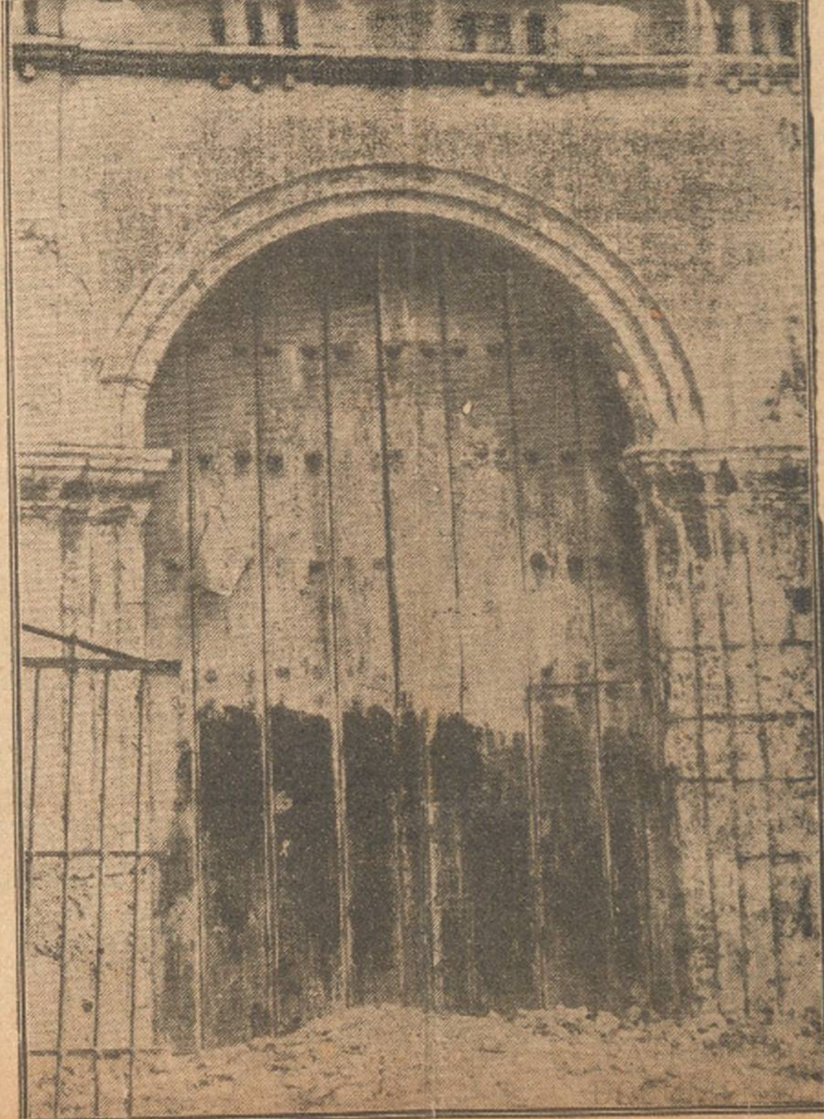
Aunque por la foto que presentamos puede advertirse el estado lamentable en que se encuentra la Iglesia — mostramos una de las entradas laterales — los arquitectos municipales opinan que el edificio puede restaurarse en su masa y

Por último nos dice el doctor Roig de Leuchsenring, que la modificación de trazados para la conservación de monumentos históricos tiene en la misma Habana muchos precedentes, como por ejemplo, el traslado de San Lázaro y las dos garitas restos de las antiguas murallas frente al Palacio Presidencial y a un costado del Instituto, y que la Iglesia de Paula, restaurada y consolidada, puede dedicarse a alguna institución pública cultural o a Museo arqueológico.