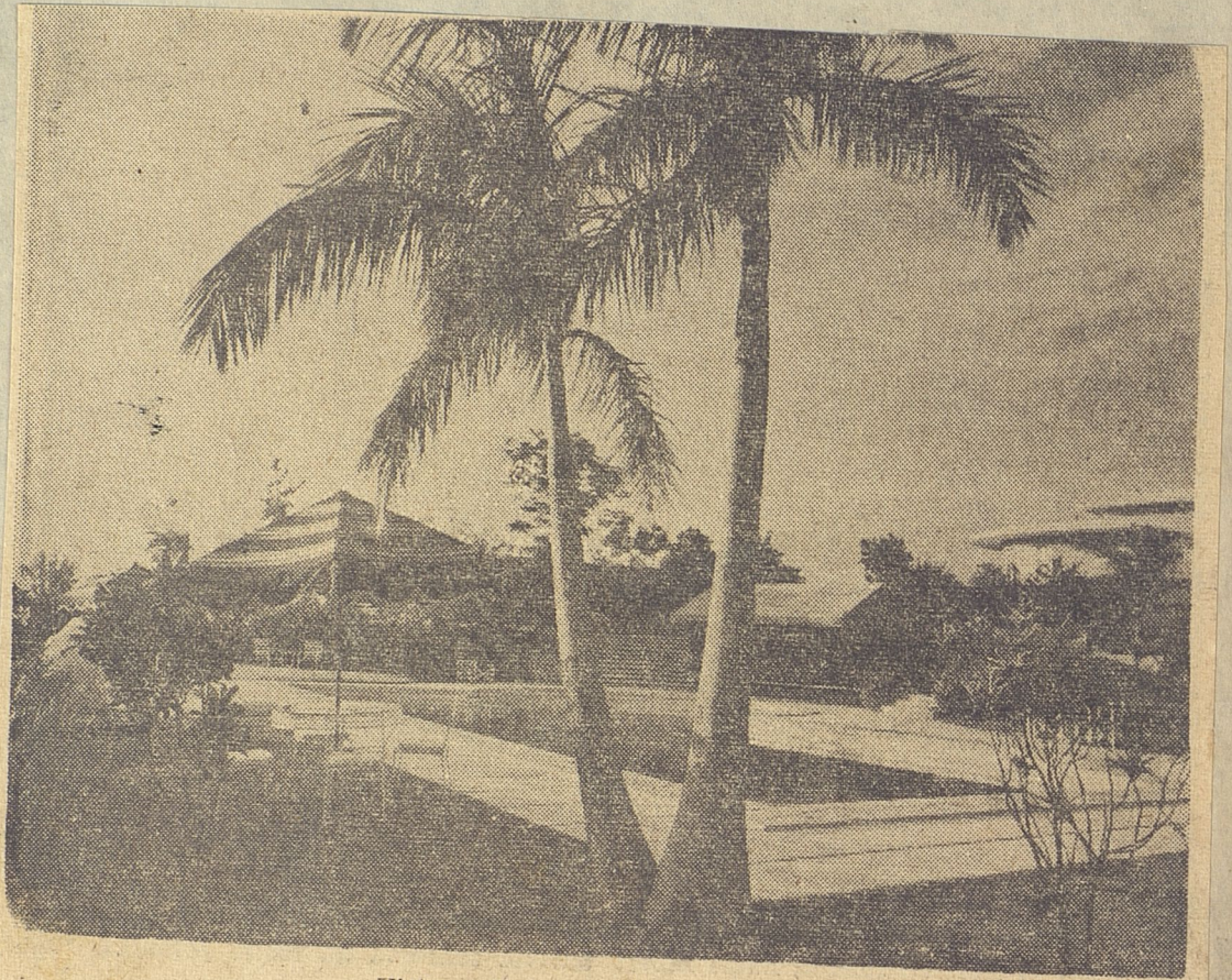
Vista exterior de la residencia.