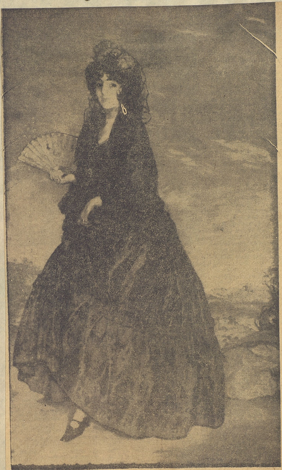
En la riquísima colección del doctor Tomás Felipe Camacho, figura este óleo del gran pintor español Ignacio Zuloaga, denominado "Rosita". Esta obra corresponde a la serie de cuadros de la época más brillante de este artista.