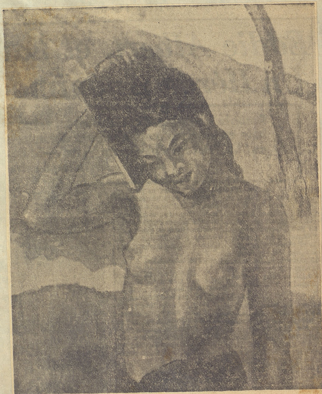
Un tipo de tahitiana, original del famoso pintor Paul Gauguin.