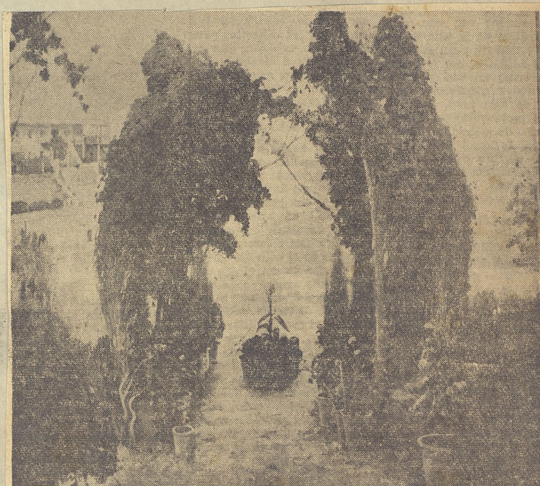
"La Casa de Rusiñol", óleo del artista Santiago Rusiñol, premiado en Roma, que figura en el gran comedor de la residencia Díaz-Camacho.