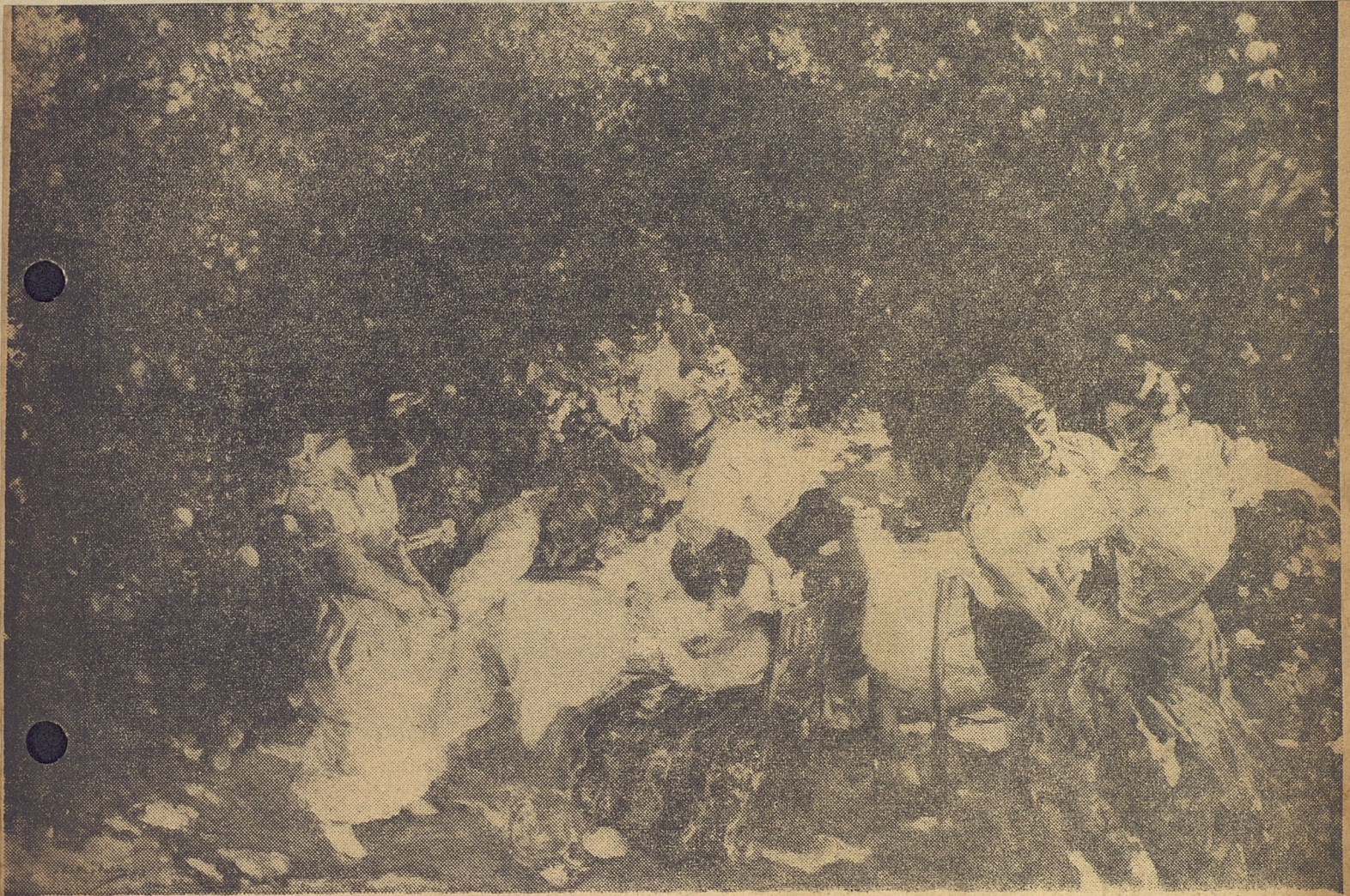
"Entre Naranjos", óleo por Joaquín Sorolla es considerado como uno de los más valiosos cuadros del gran pintor español.