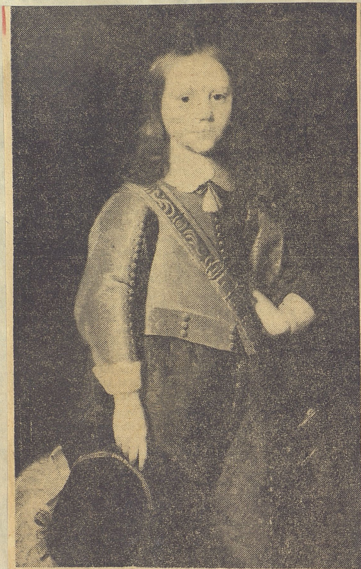
Oleo sobre tabla de 0.94 metros de alto por 0.64 metros de ancho, firmado y fechado: J. J. Stomme, 1648 "Obra de primer orden, por todos conceptos", del célebre pintor holandés.