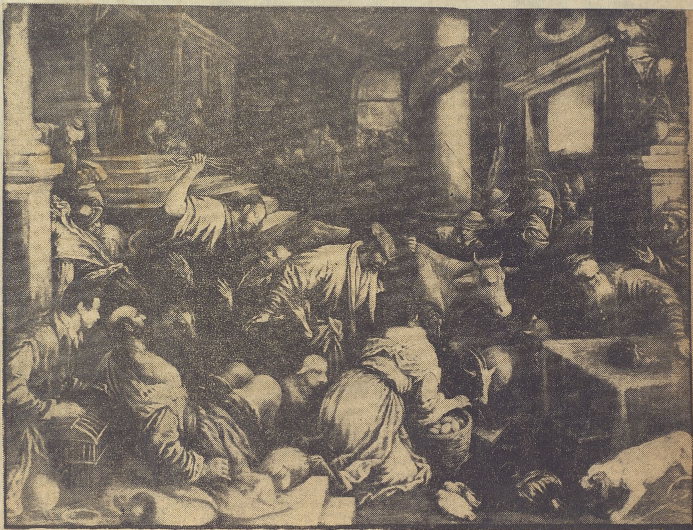
"Jesús expulsando a los mercaderes del Templo", obra del artista Leandro da Ponte, llamado el Bassano.