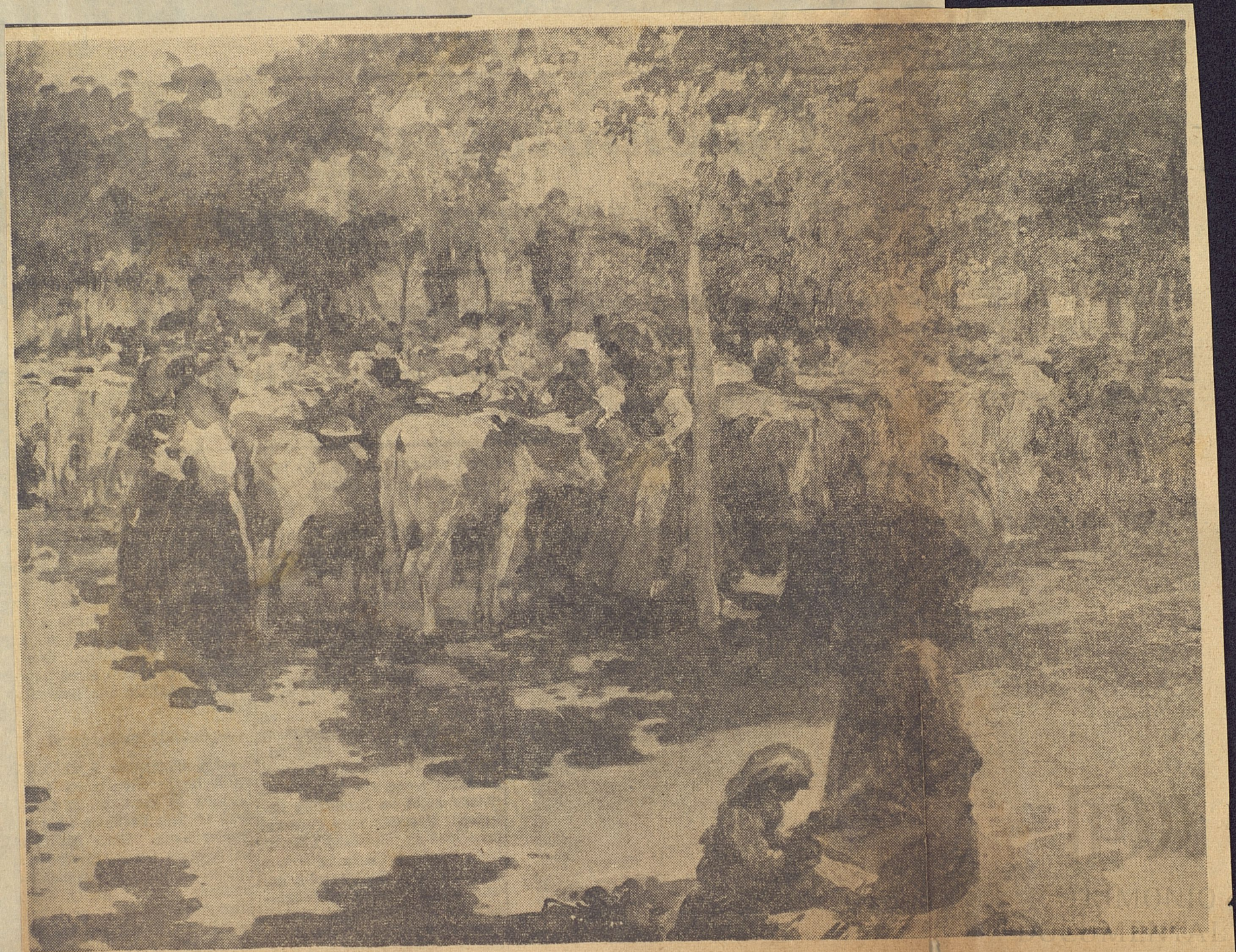
"Feria de las Vacas en Galicia", óleo de J. Vila Prades.