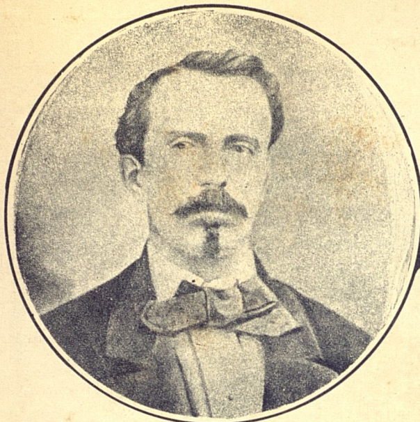
Licenciado Carlos Manuel de Céspedes y Castillo.