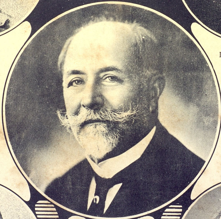
Gen. Francisco Carrillo Morales. 1921—1925.