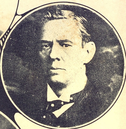
Dr. Alfredo de Zayas y Alfonso. 1909—1913.