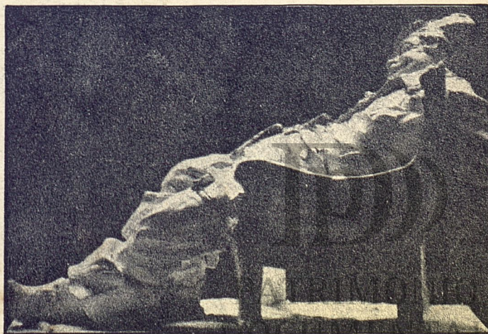
DOCUMENTAL FALLSTAFF OFICINA DEL HISTORIADOR

Y si las leyes, desde luego, no hacen por sí solas la felicidad de los pueblos, y muchos de nuestros males sociales de la hora presente hay que buscarlos, más que en otra cosa, en los hombres mismos—directores y dirigidos, desastrosamente educados unos y otros durante cuatro siglos de corrupción esclavitud—esa tarea de reformar a los hombres no es fácil ni de un día sino la obra paciente y larga de años y años de constante educación, literaria y cívica; no es menos cierto que una legislación saludable y adecuada facilita el desenvolvimiento seguro y estable de los pueblos nuevos, y acentúa su fisonomía y su carácter, ante la comunidad jurídica internacional, de acuerdo, además, con la necesidad en que todas las naciones se encuentran de renovarse constantemente, traduciendo en preceptos legales los progresos del siglo y las modernas doctrinas de la civilización, así como las necesidades de la masa social en todas sus manifestaciones.