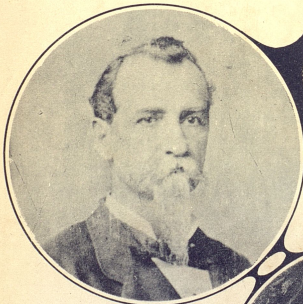
Coronel Juan Bautista Spotorno Urubí