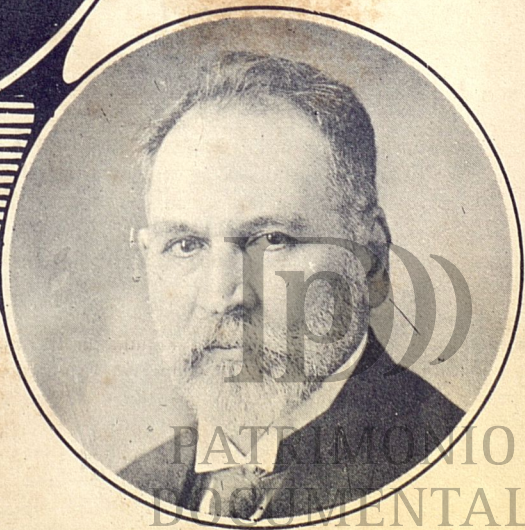
Gral. Emilio Nuñez y Rodríguez. 1917—1921. HABANA