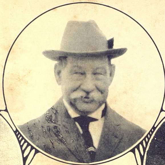
Gen. Dr. Domingo Méndez Capote 1906.