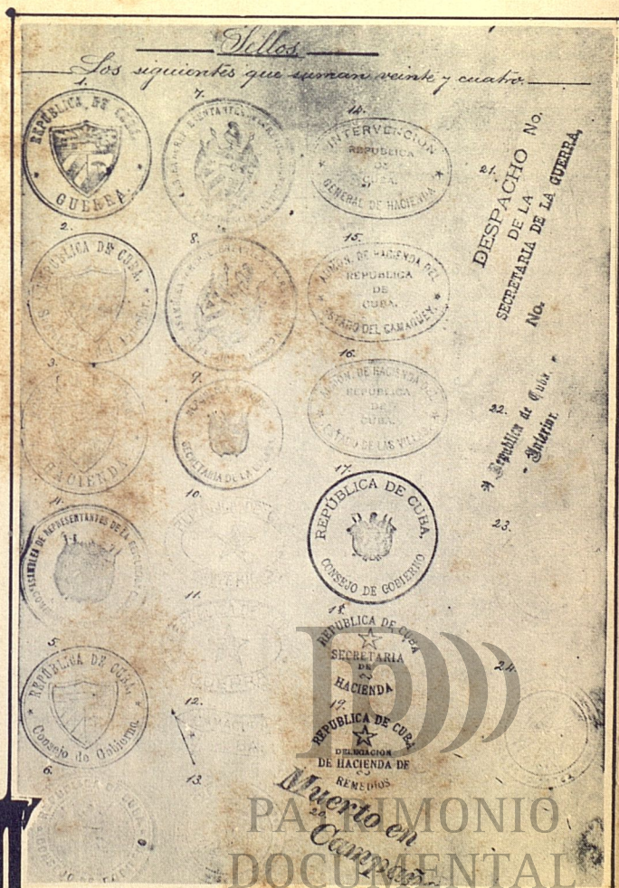
Facsimile de los distintos sellos usados por las autoridades y oficinas revolucionarias durante la guerra del 95.