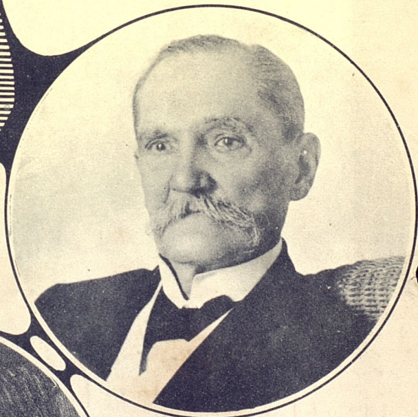
Tomás Estrada Palma.