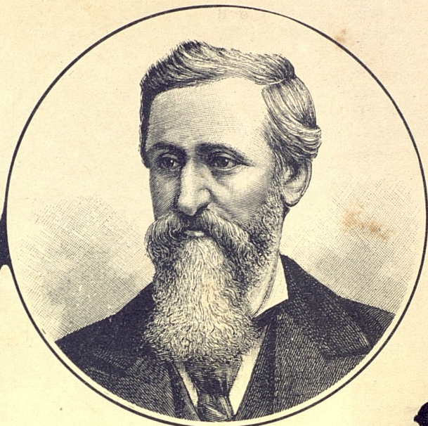
Salvador Cisneros Betancourt, Marqués de Santa Lucía.