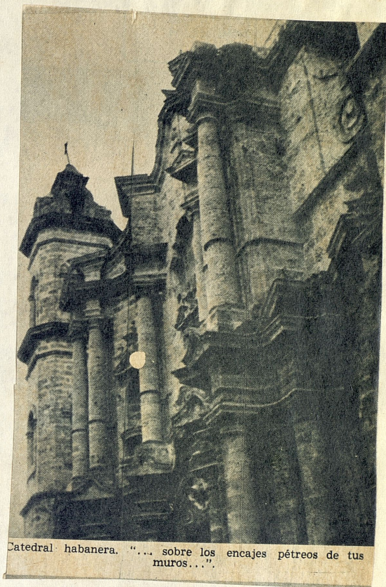
Catedral habanera. "... sobre los encajes pétreos de tus muros...".