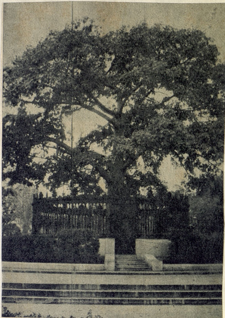
El Arbol de la Fraternidad. "Porque tú simbolizas nuestro amor por la América".