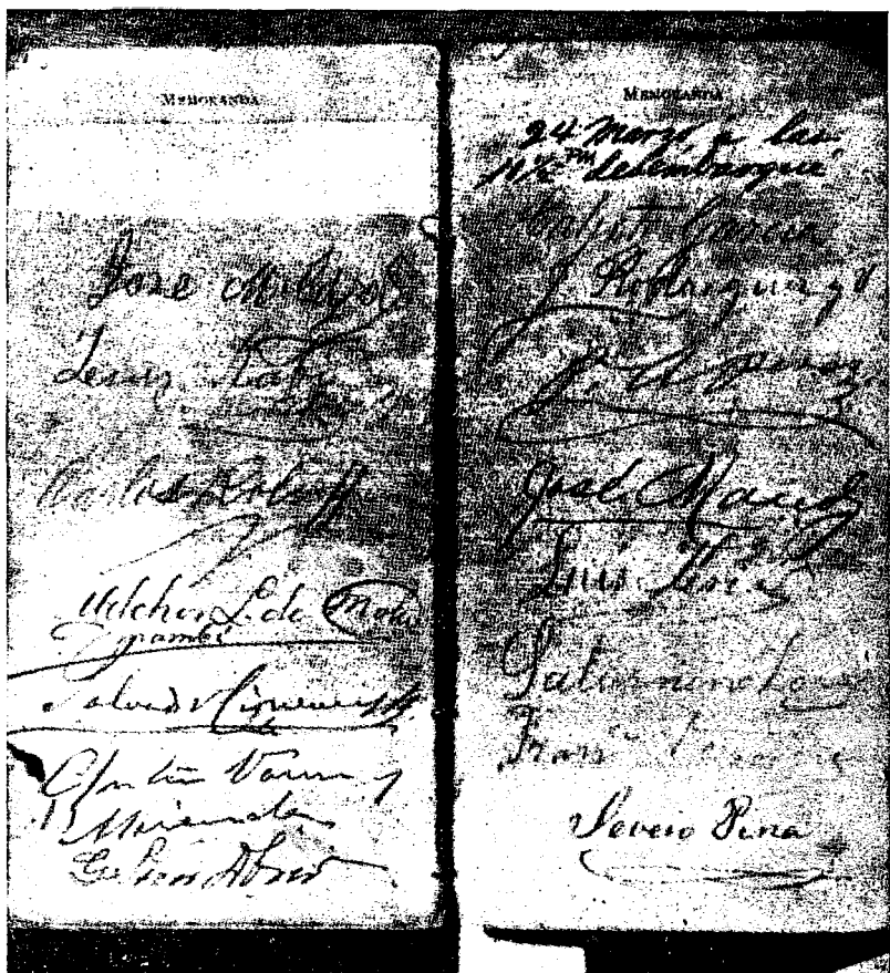
Facsímile de la hoja de la libreta en que recogió las firmas de distintos libertadores.