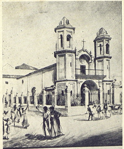
Iglesia del Cristo. Acuarela. Colección Evelio Govantes.