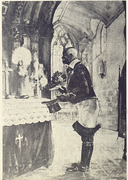
El místico del An- gel. Acuarela. Co- lección Evelio Go- vantes.