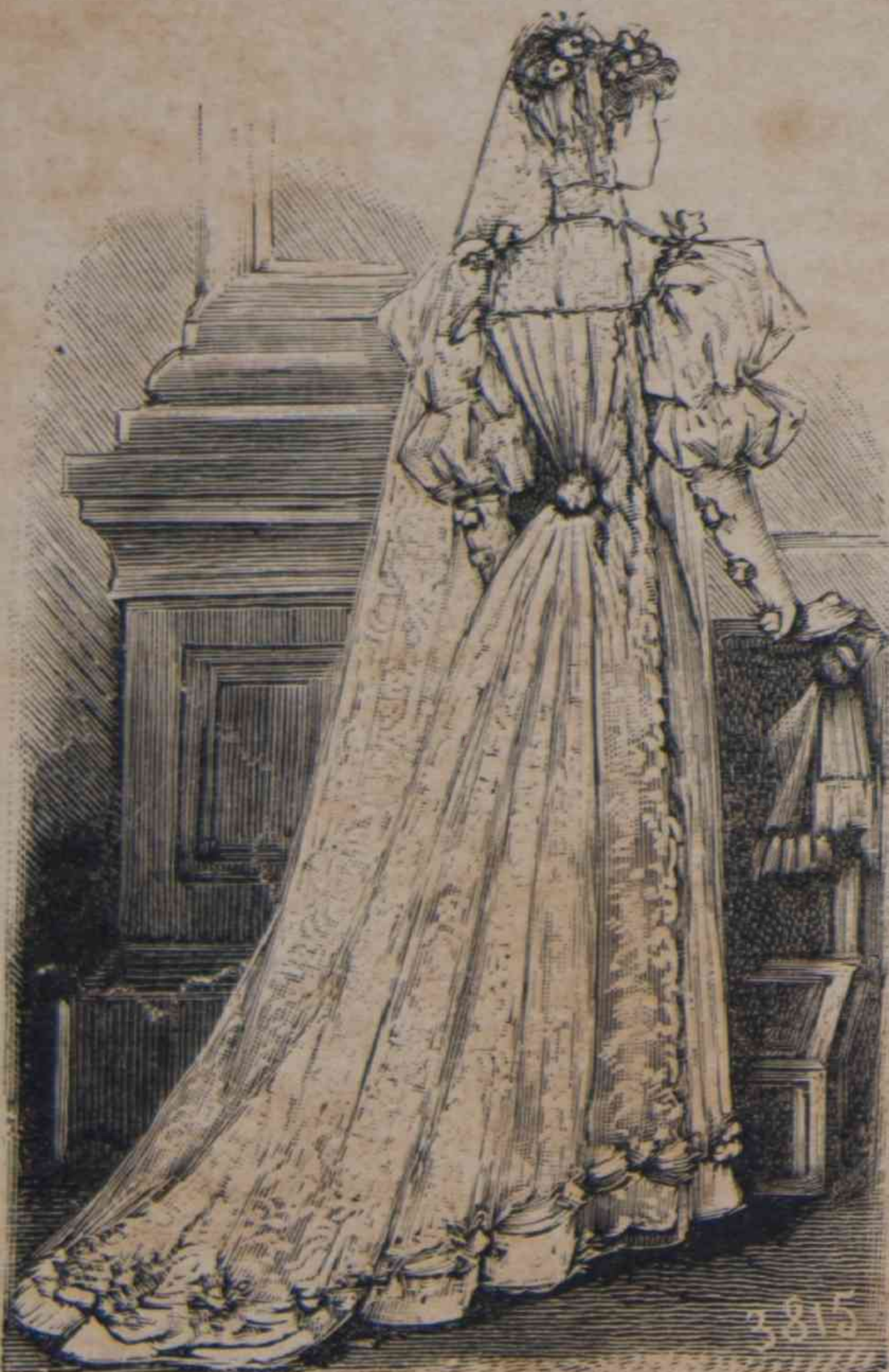
4. — Traje de novia estilo Imperio.