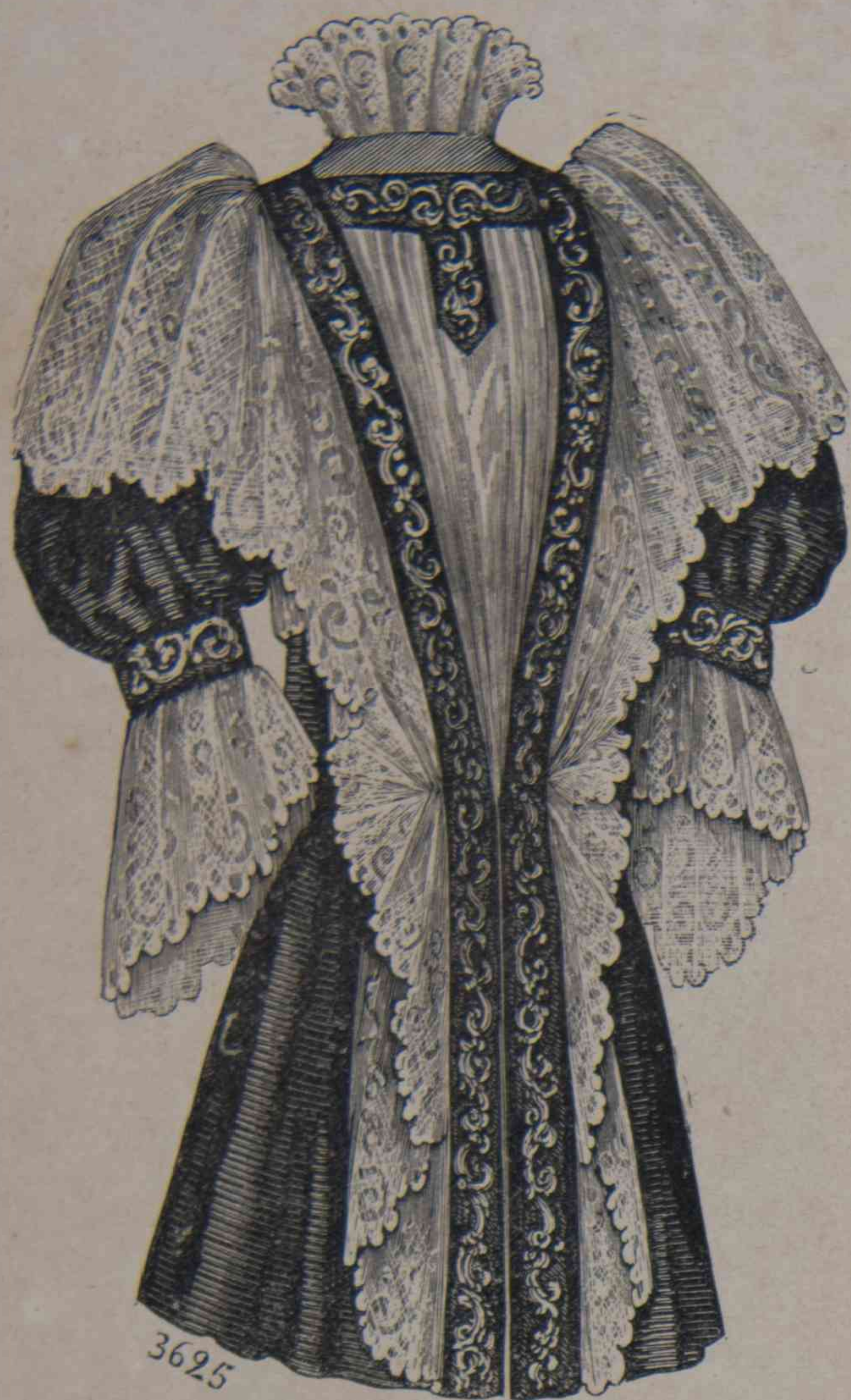
9. — Cuerpo de interior.