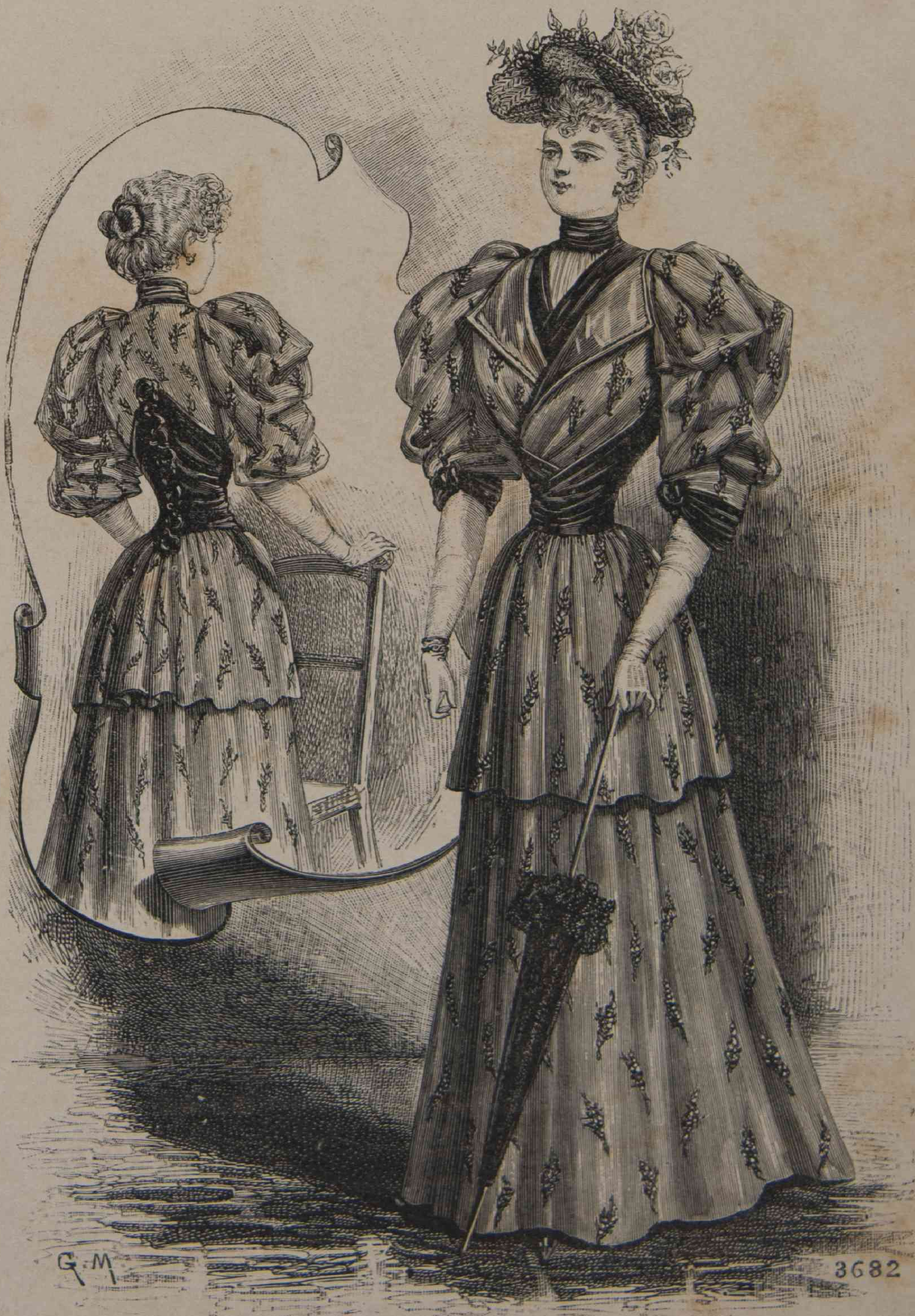
1 y 2. — Traje de primavera (espalda y frente).

El Concours hippique que anualmente se celebra en el Palacio de la Industria atrae todos los días las más esquisitas elegancias de esta Babilonia.