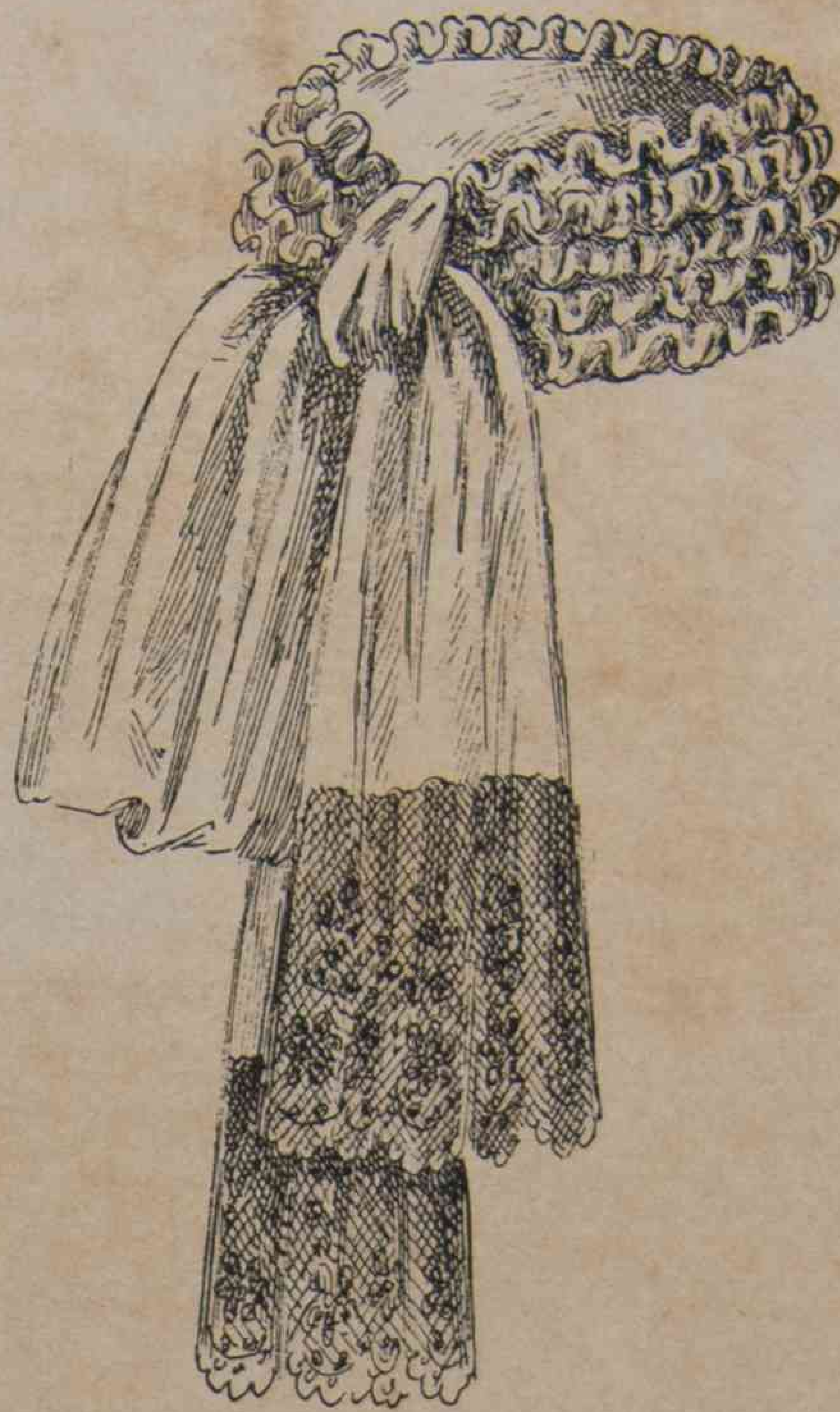
6. — Cuello de gaza de seda acolmenado.

9. — Cuerpo de interior , en seda rayada cambiante verde y rosa. El camisolin en linon blanco, está encuadrado y guarnecido, así como los delanteros del cuerpo, por un galon verde bordado rosa y oro. Un volante de viejo punto forma pelerina detrás. Hombreras y berta aconchada bajando hasta, el inferior del cuerpo. Mangas abolsadas ajustadas por un bracelete de galon bordado. Manguitas y collarin de viejo punto.