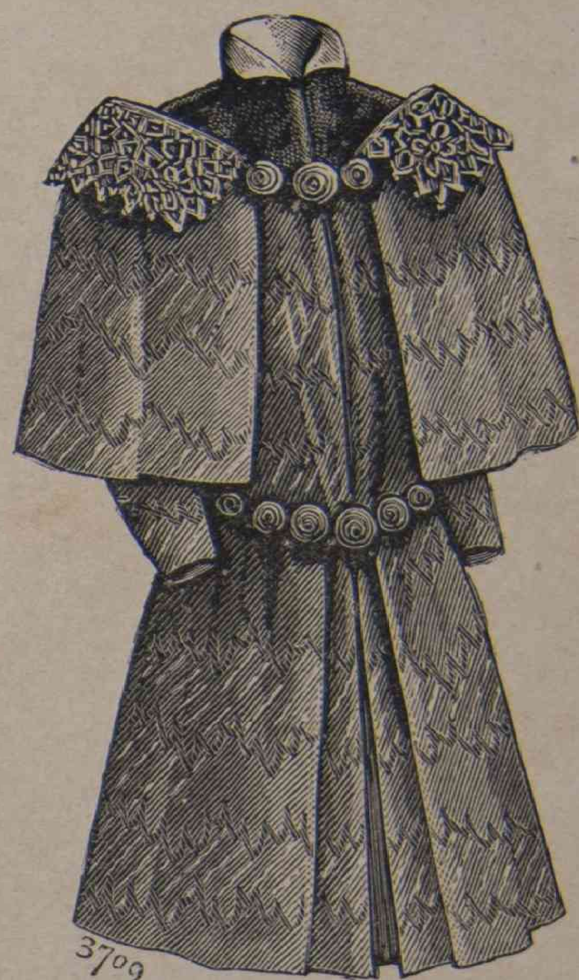
16. — Capa de niño.

Puesto que nos ocupamos de la cuestion de los colores, que todos los dominios invaden, hablemos algo de