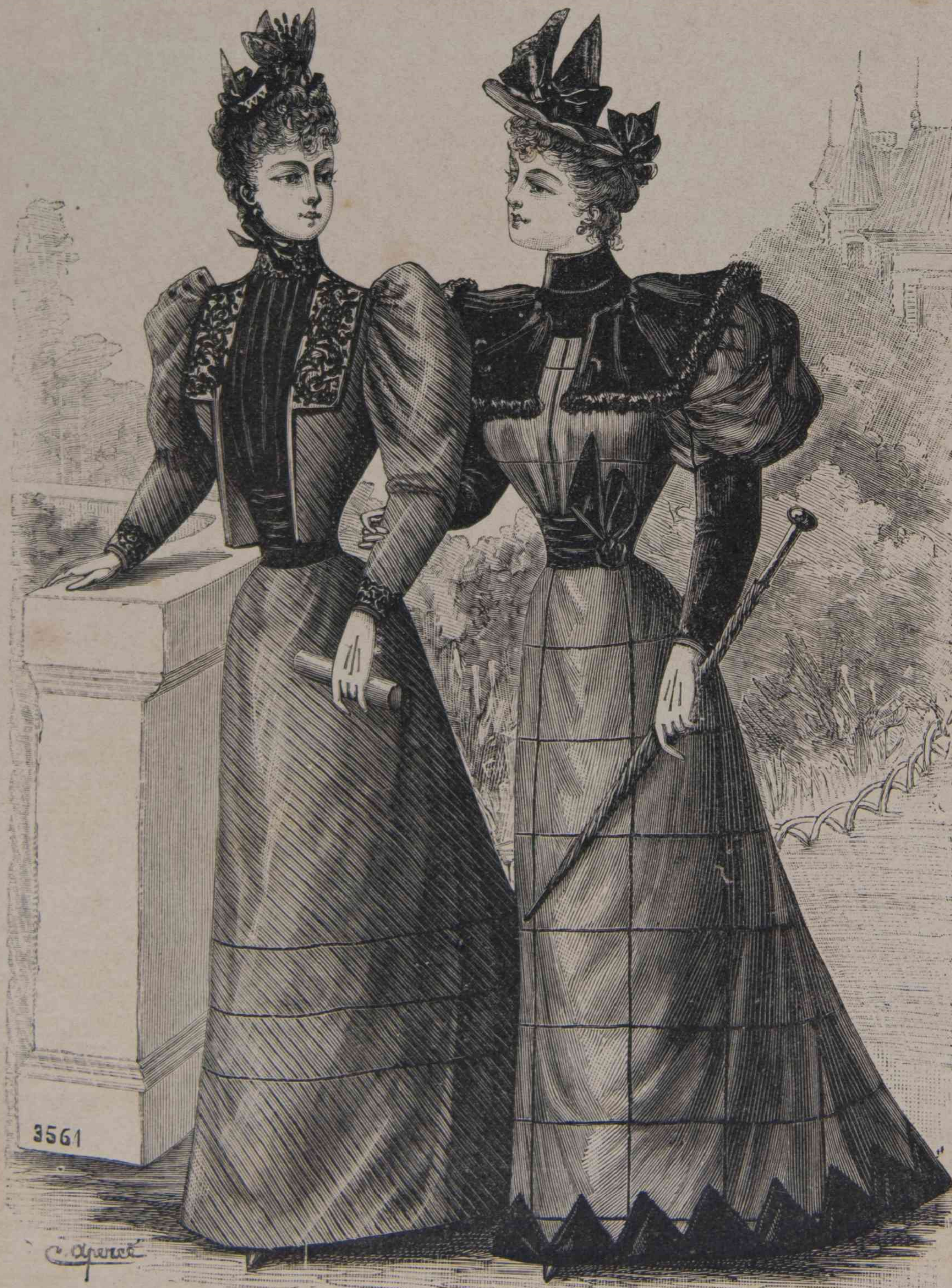
A. 11 y B. 12. — Trajes de paseo de mañana.

de percal ó nansouck perfectamente ajustado al talle, habia sido algo abandonado; se habia cedido á la atracción de los pequeños jerseys de seda, muy coquetones, y agradables el primer día que una se los pone. La