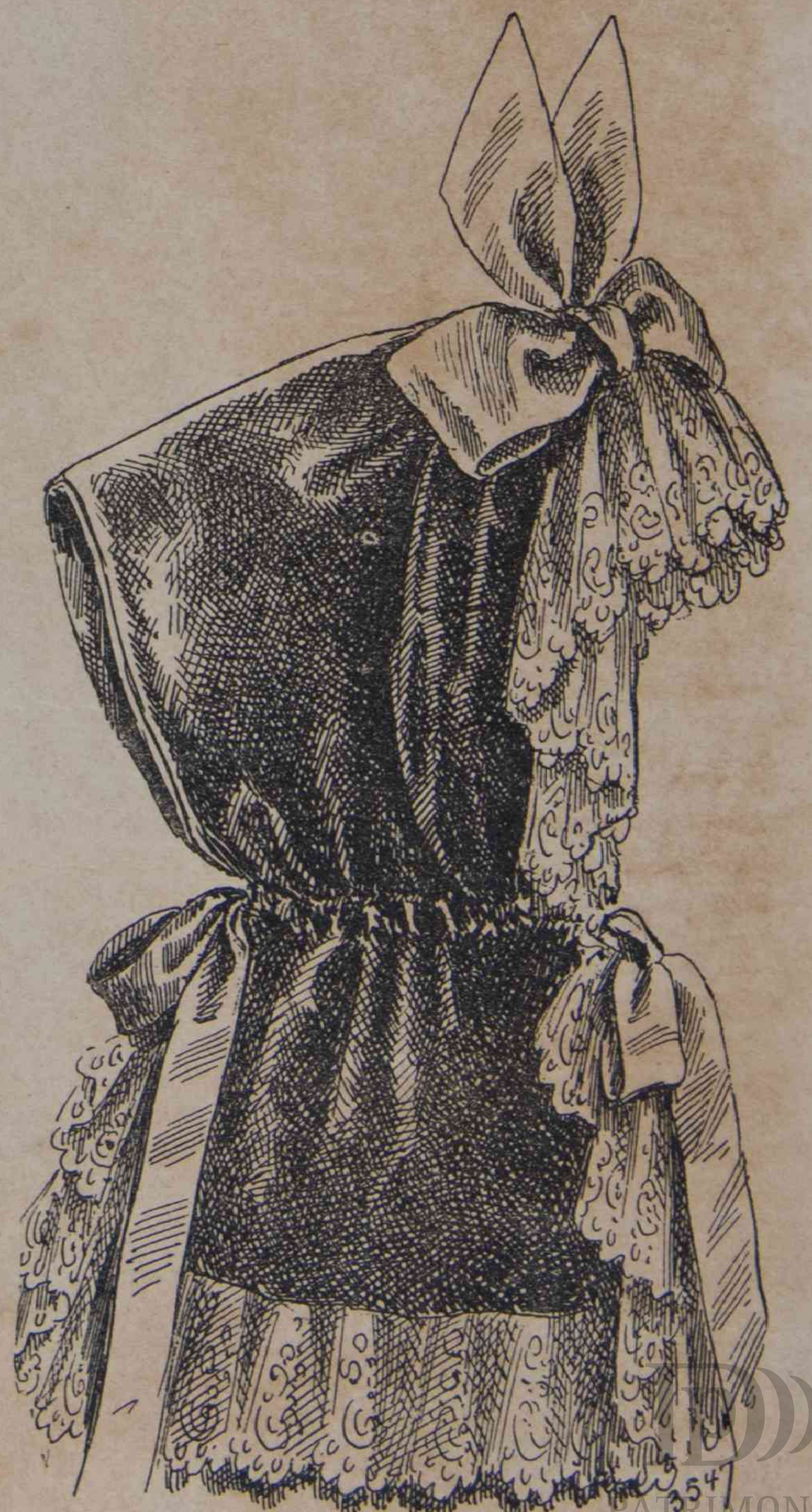
5. — Capellina salida de teatro.