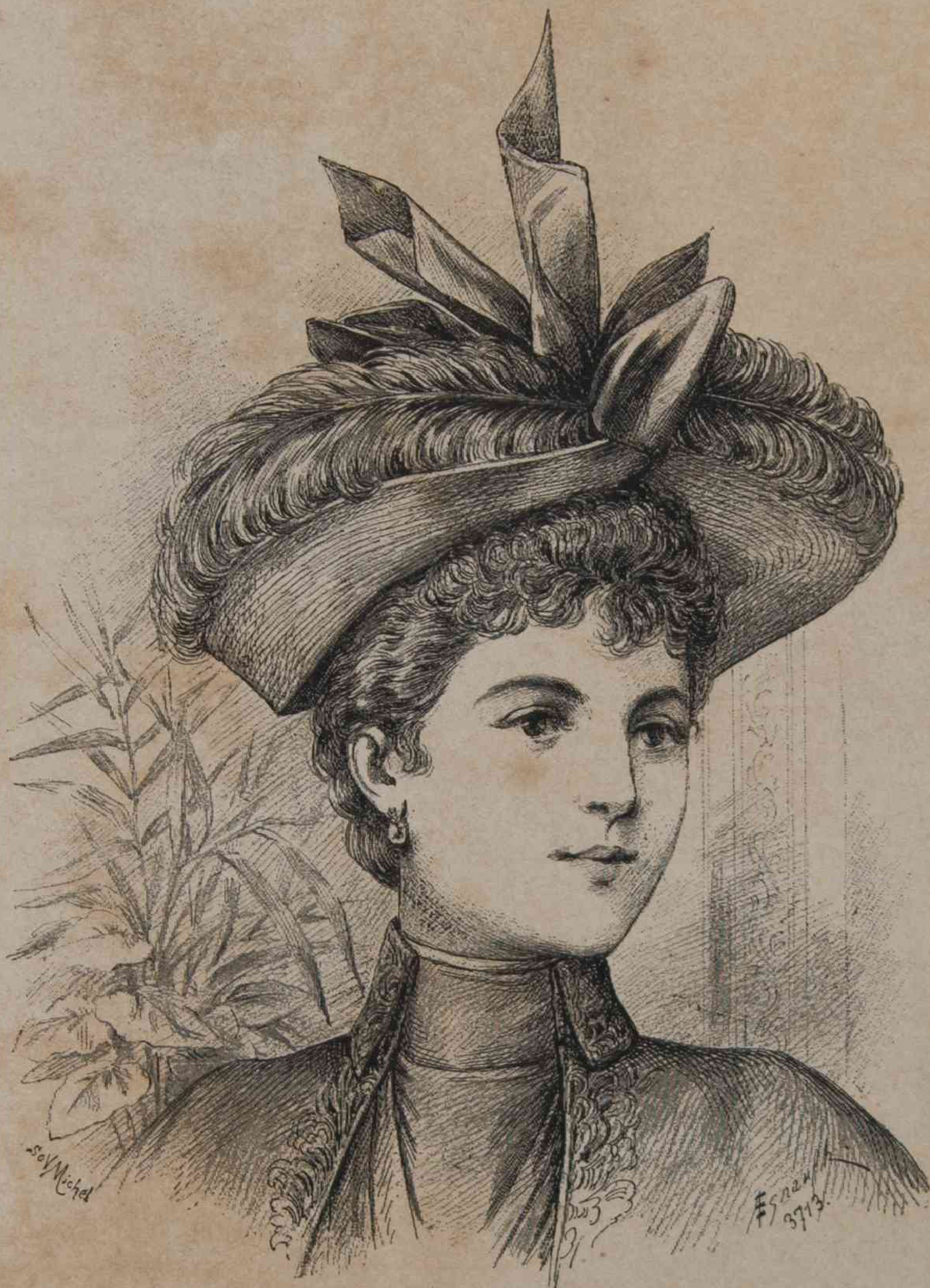
7. — Sombrero de paja.

C. 13. — Traje de niño de foulard, con lunares azules sobre fondo rojo amapola. La falda fruncida al talle está adornada por un punto de espina sobre la orla. El cuerpo está plegado, un ancho cinturón en grueso grano rojo adornado de dos puntos de espinas y cerrado por una hebilla de fantasia. Berta de encaje, retenida en los hombros