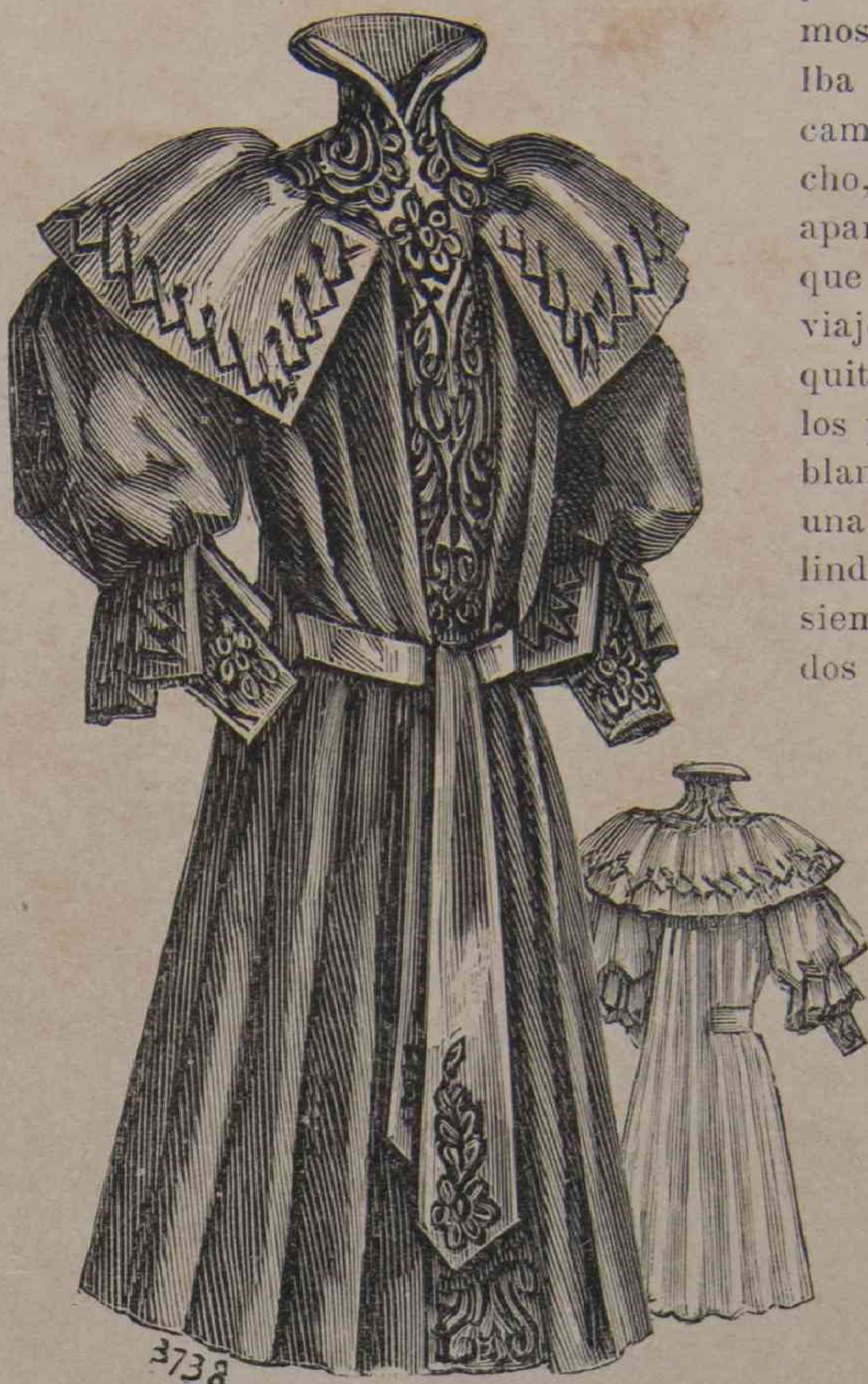
14 y 15. — Capa de niña (frente y espalda).

experiencia nos ha vuelto a conducir el cubre corsé adornado de bordados, de entredoses, con aplicaciones de encaje, que no se deforma. El jersey se ensancha muy pronto y no adiere; cuando ha sido limpiado; es peor se arruja de todos lados. Para rejuvenecer el cubre corsé se le ha cortado a lo bolero: se redondea sobre el pecho y