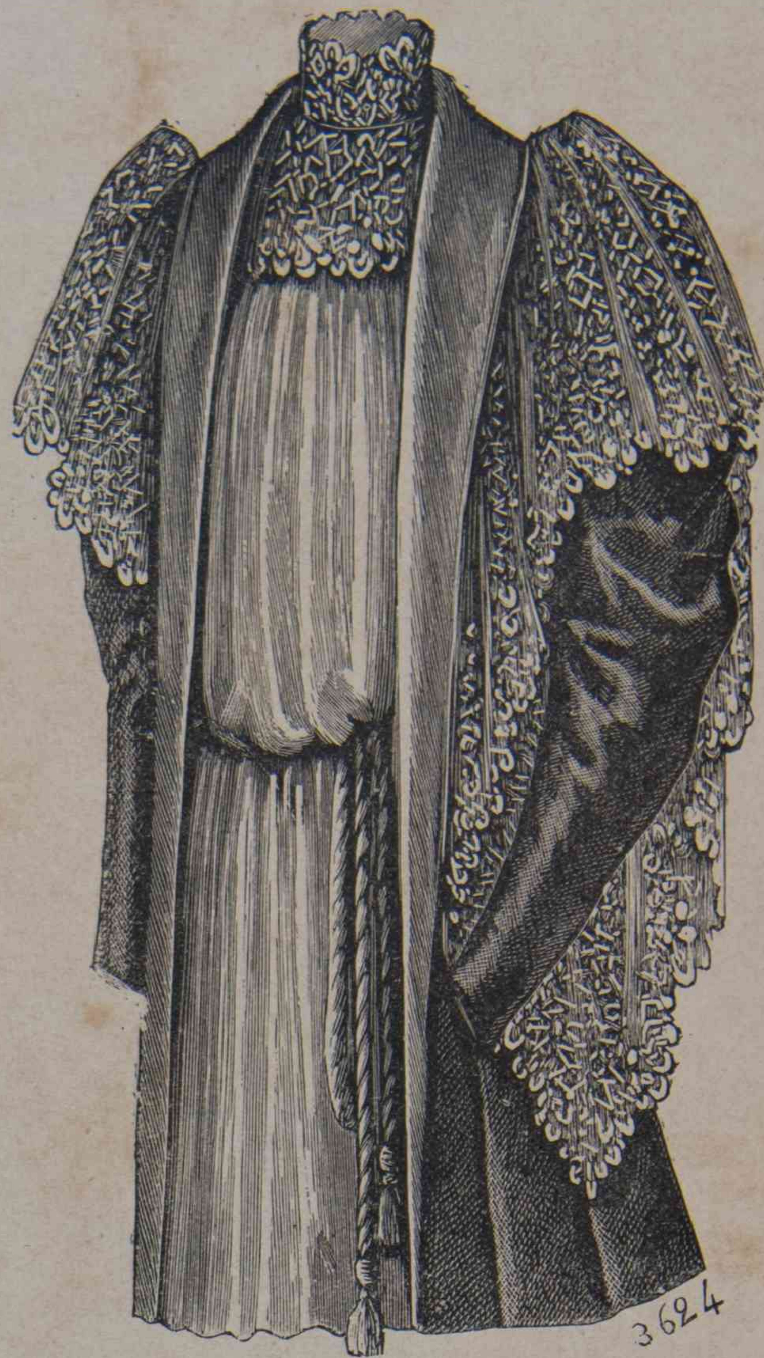
10. — Déshabillé Dimitri.

quetales cosas sean absolutamente indispensables.