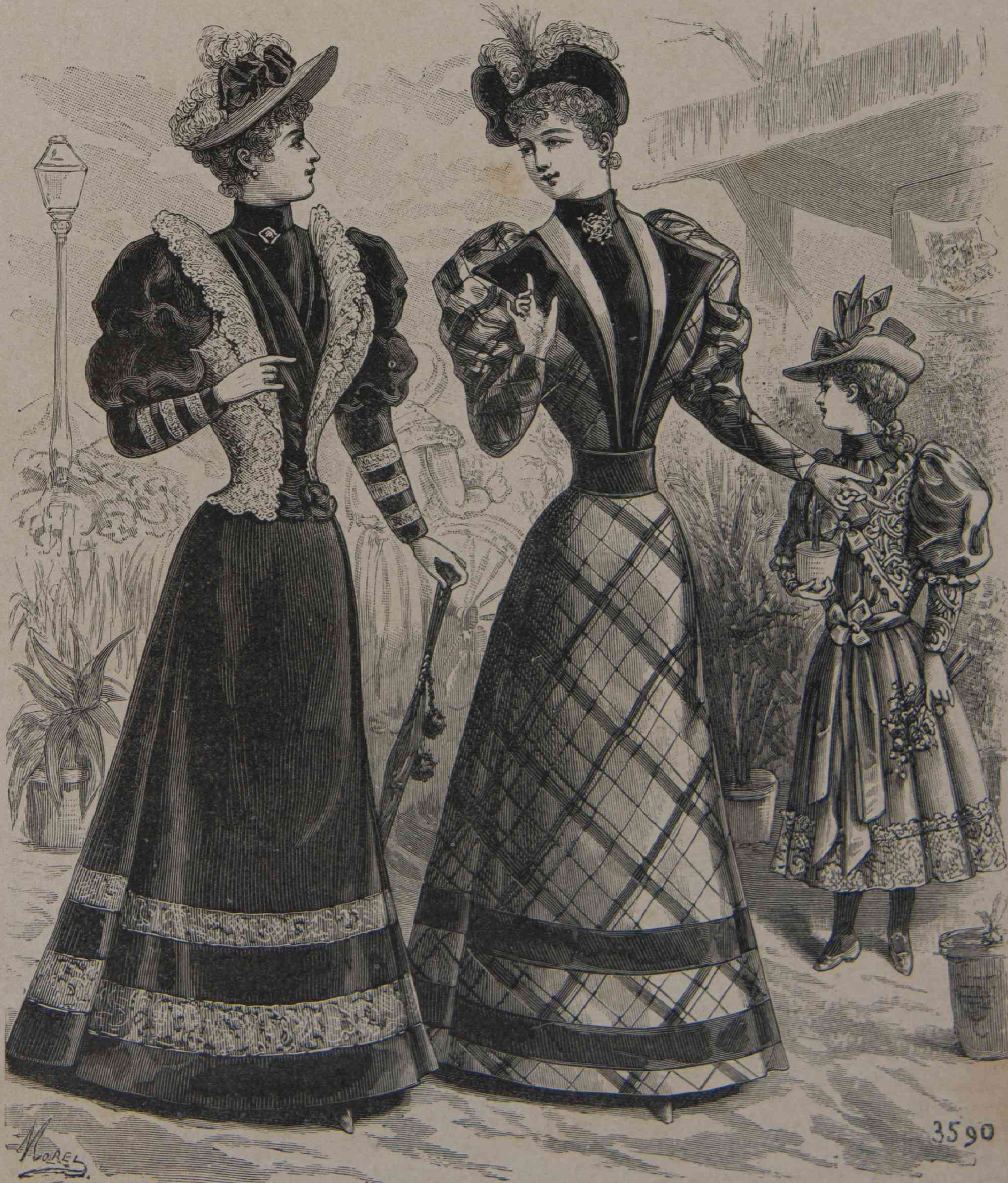
17 y 18. Traje de paseo. — 19. Niña de 8 años.

se ven de seda malva, verde suave, azul, rosa, reseda; están adornados de una orla calada, pero sin cifras. En los tres colores: rosa, azul