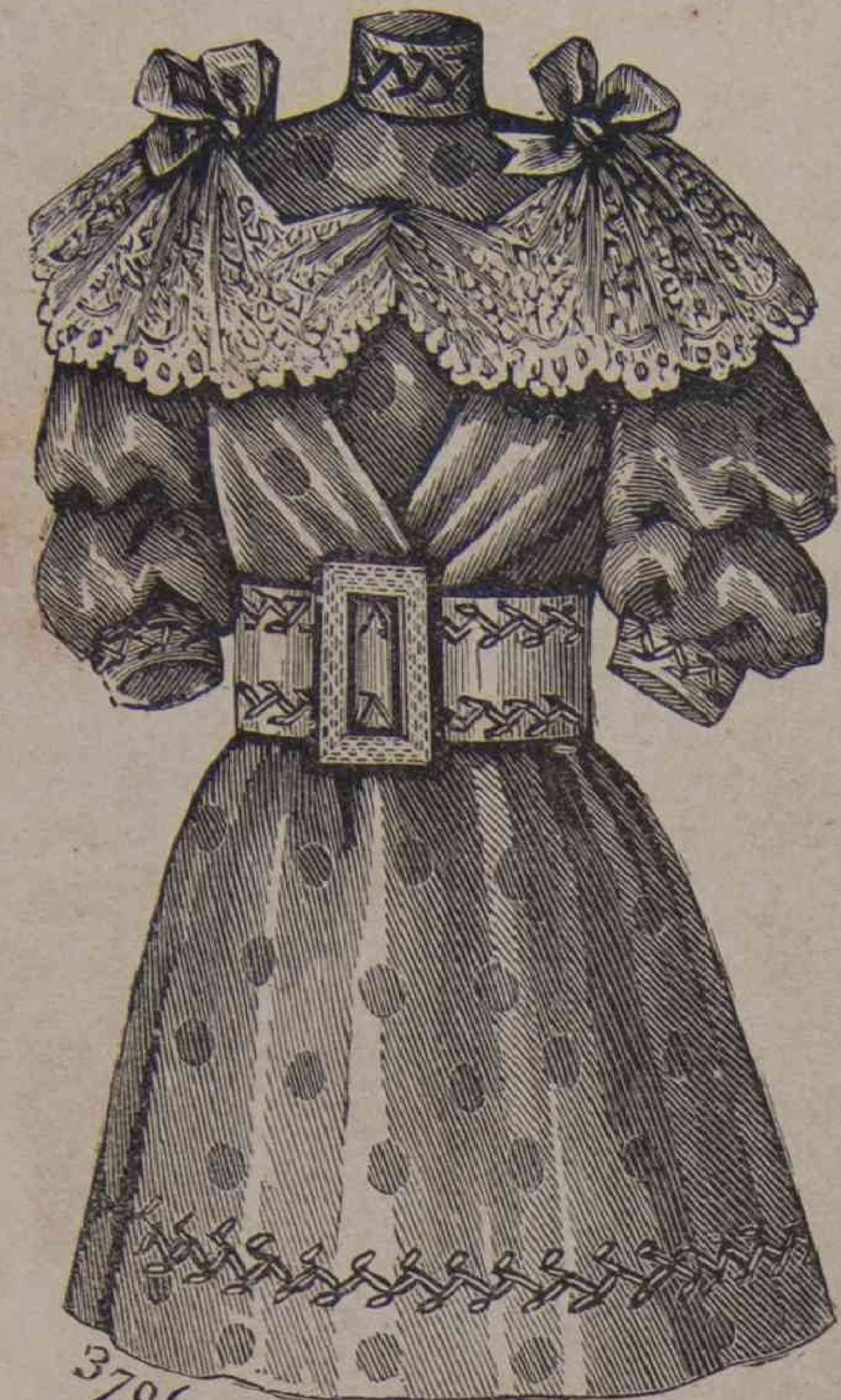
G. 13. — Traje de niño.

que se impone. Se la puede confeccionar con todas las telas; segun el ancho de éstas habrá más ó menos costuras, he aquí lo