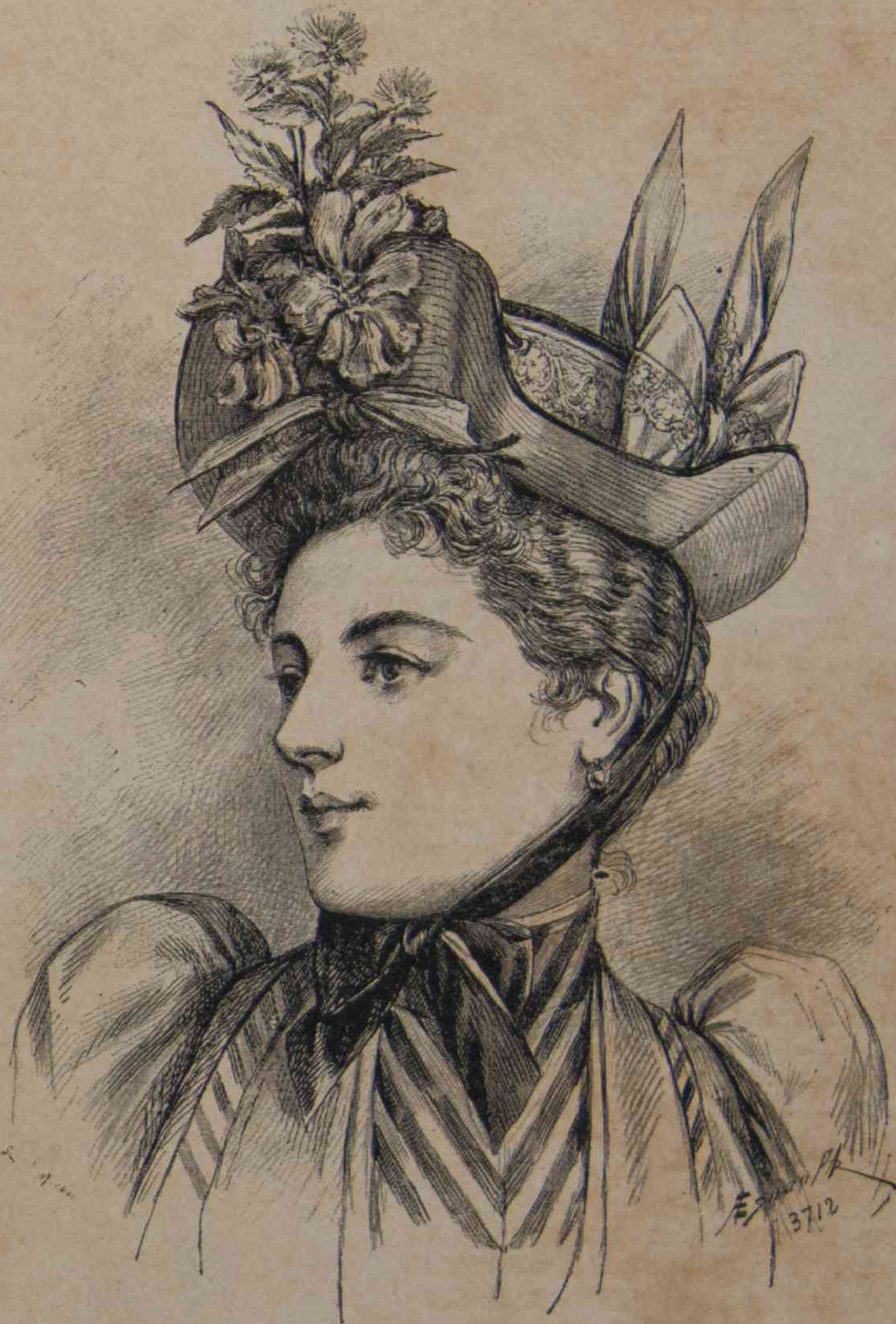
8. — Sombrero de paja.

10. — Déshabillé Dimitri en gruesos granos nacarat, adornado de solapas de seda oro pálido. El chaquet con faldones largos, se abre sobre una blusa de suráh crema, ajustada á la cintura por un cordon blanco y oro. Cuello, canesú y segundas mangas de punto de Venezia. Mangas 1830 abolsadas de arriba y ajustadas en los puños.