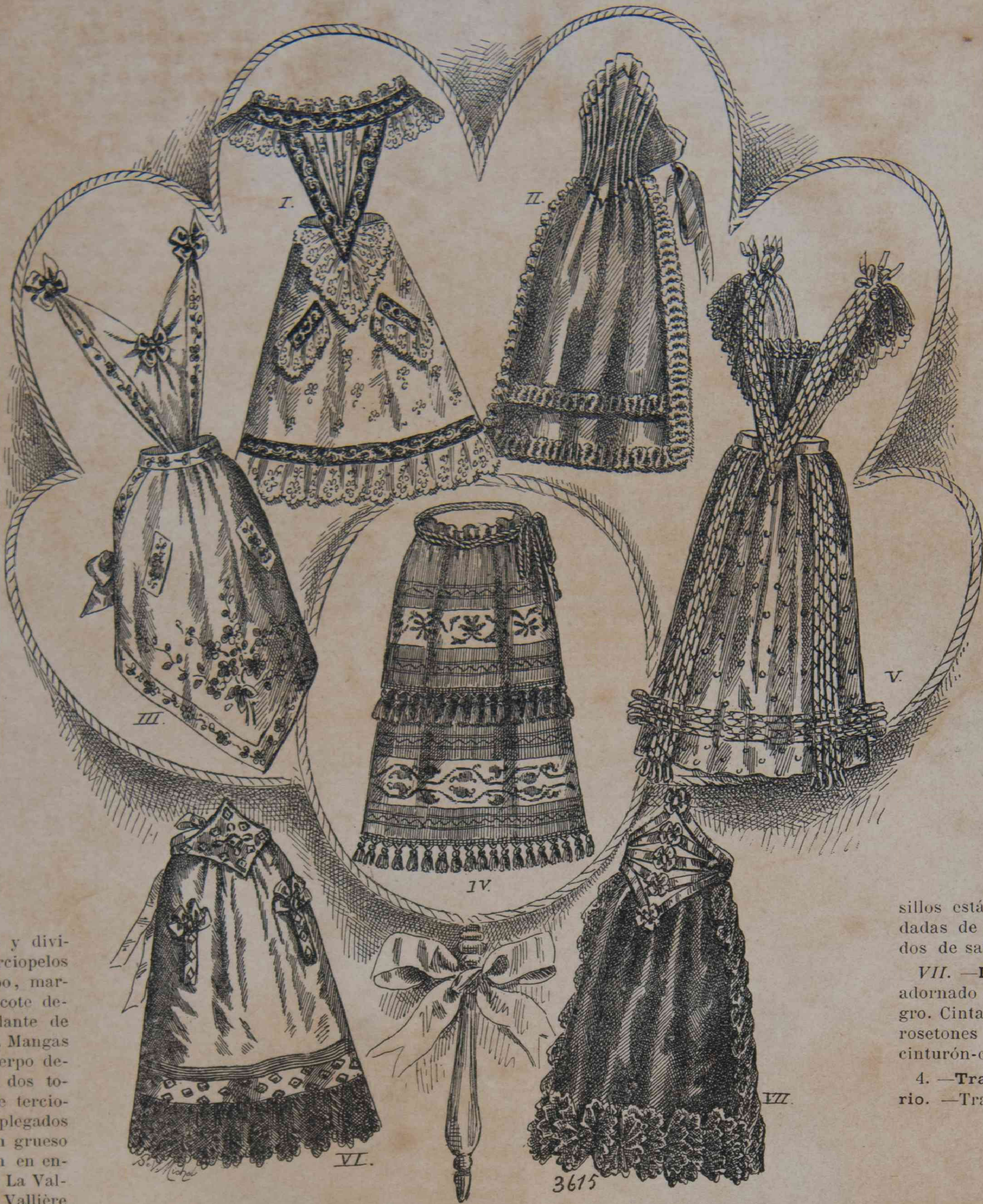
3. — Delantales para señoritas y niñas.

4. —Traje de novia estilo Imperio. —Traje princesa enlazado atrás