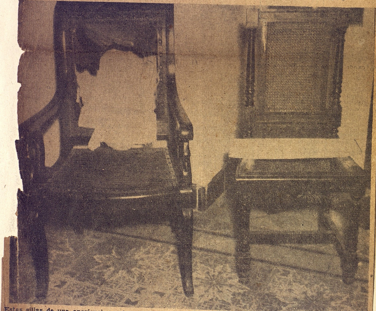
Estas sillas de una apariencia confusa, sin respaldo ni rejillas, son utilizadas en la secretaría de Gobierno del Tribunal Supremo. Nuestro fotógrafo al obtener la instantánea esperó a que las personas que las ocupaban se retiraran. Tal es el mobiliario con que cuenta hoy nuestro máximo organismo judicial.