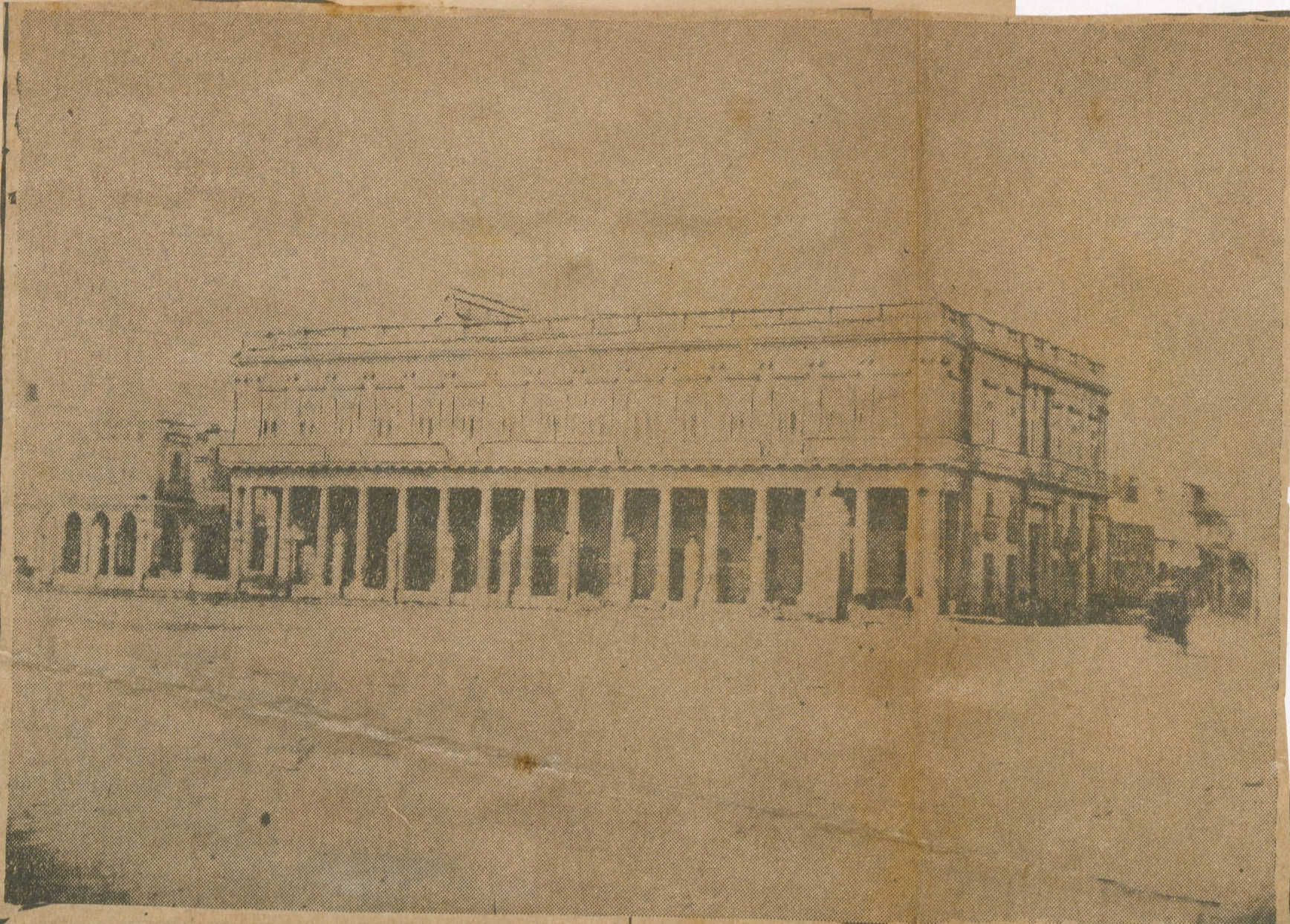
El Palacio de Aldama en la época del saqueo, (de un grabado antiguo.)