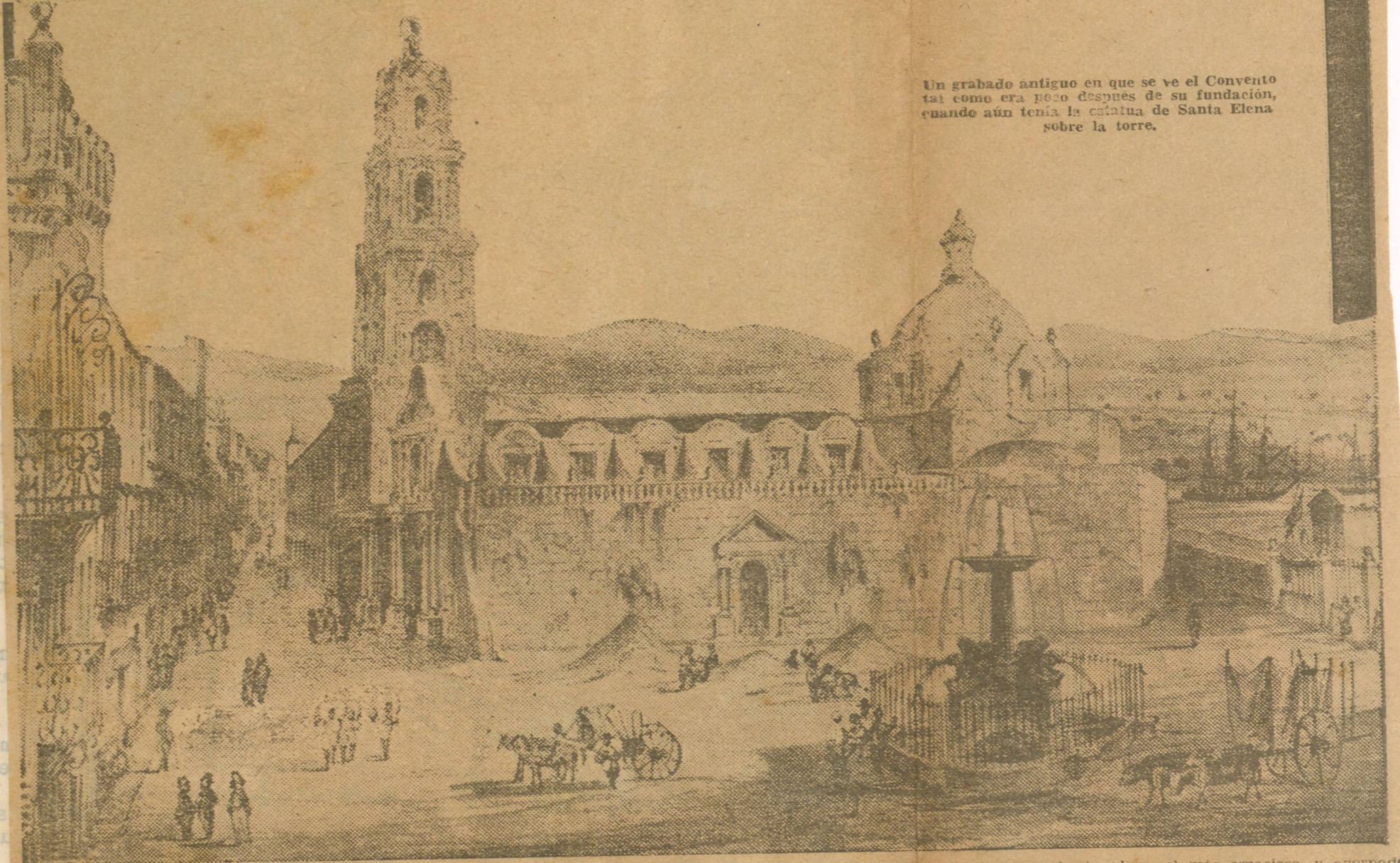
Un grabado antiguo en que se ve el Convento tal como era poco después de su fundación, cuando aún tenía la estatua de Santa Elena sobre la torre.

D EL CONVENTO de San Francisco, como el de San Juan de Letrán (Santo Domingo), hoy demolido, cuenta una tradición, que muchos tienen por verídica, que entre los religiosos que residieron en sus claustros se contaron dos santos: San Francisco Solano y San Luis Beltrán, llegándose hasta indicar por algunos las celdas que ellos ocupaban en aquellas man-