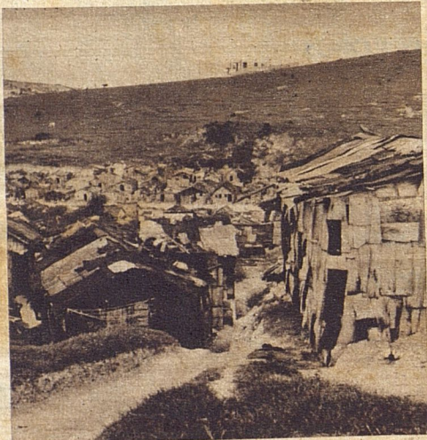
Las escabrosidades del terreno no fueron obstáculo a los constructores del barrio de Las Yaguas.