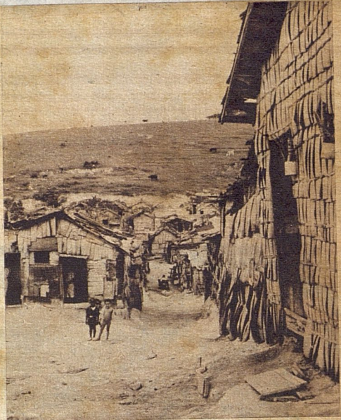
Niños que crecen vegetativamente, sin otros cuidados que los que le proporciona la Agrupación Católica Universitaria.