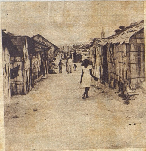
En la «patria del kilo» la vida se desenvuelve normalmente, casi festivamente. Los yagüenses se han acostumbrado a mirar de frente a la miseria.