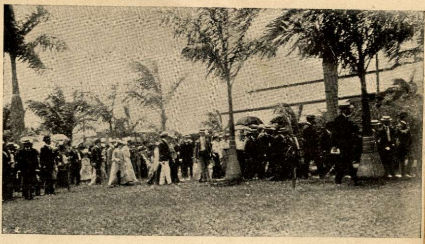
LLEGADA DE LOS CONFERENCISTAS AL CENTRAL "CARACAS" (CRUCES)

Hay, en efecto que ayudar al pobre, pero dentro de límites definidos y contribuyendo á hacer útil su propio esfuerzo que al cabo es el más valioso de todos. Elevar al desgraciado, despertar sus abatidas energías, llegar quizás á hacerlo apto y útil para la vida libre de la República que tanto dolor ha costado y que hoy se levanta estimulada por un hermoso porvenir. "La libertad, nos decía el comandante Kean, es como el lirio de los Alpes, que crece á las orillas de los campos cubiertos de nieves perpétuas y que sólo es dado recoger al que escala las escarpadas