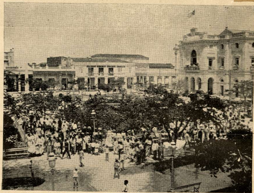
VILLA CLARA: ASPECTO DEL PARQUE Á LA LLEGADA DE LOS CONFERENCISTAS