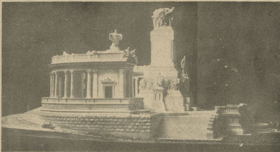
Maqueta del monumento al general José M. Gómez, por Nicolini, vista de perfil, en la que se puede apreciar la escultura del "vermicelli" (arte macarrónico) que impera en toda la obra.