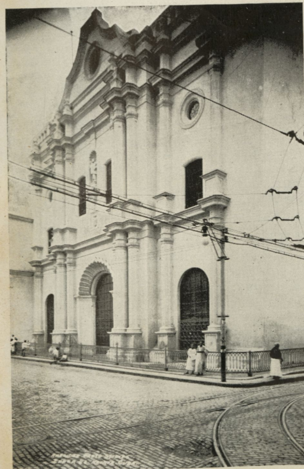
Fachada principal de la iglesia de la Merced.