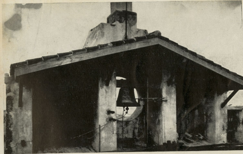
Esta campana ha tocado para vivos y muertos desde 1792.