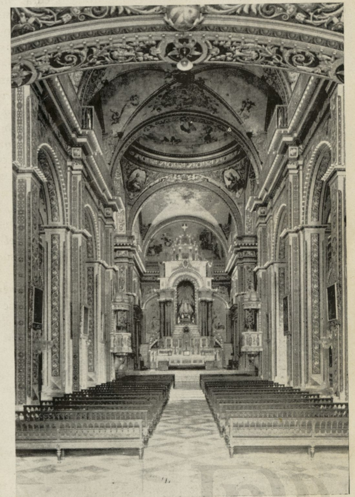
Nave central de la iglesia de la Merced permitiendo ver su altar mayor y el exceso de decorado que la adorna.