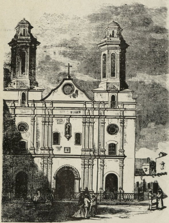
Grabado en madera publicado en el año 1871 en la "Ilustración de Madrid", que reproduce la fachada principal de la iglesia de la Merced.

En el año 1763, al ser atacada y tomada La Habana por las fuerzas inglesas que capitaneaba el Conde de Albemarle, se paralizaron las obras, permaneciendo en ese estado hasta el año 1773