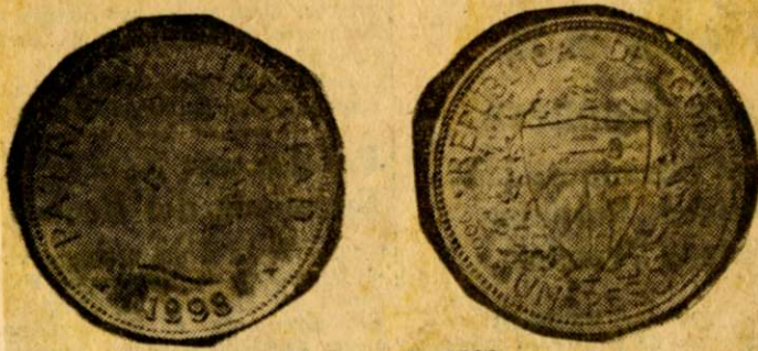
El peso de 1898.