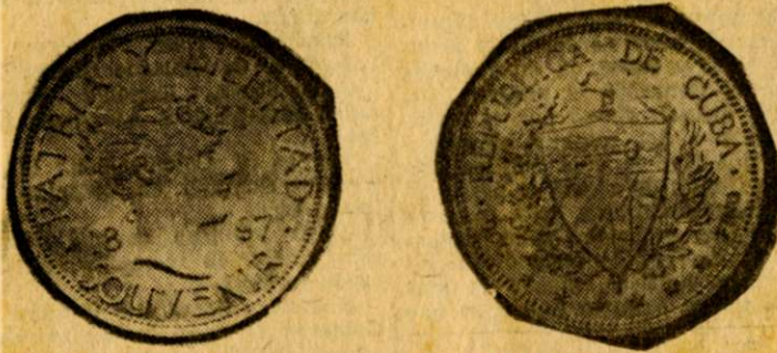
El peso "Souvenir" de 1897