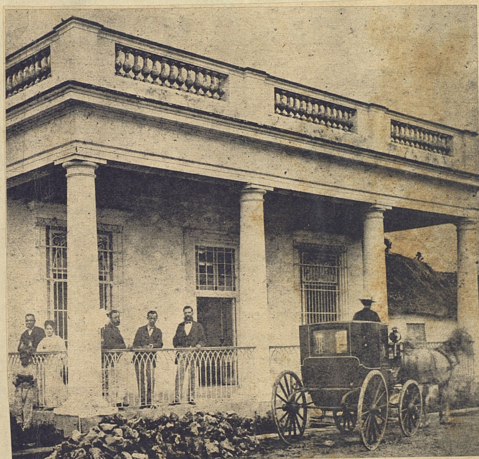
Casa Real 129 (Puentes Grandes), construida por el arquitecto Benitez Uthon, que aparece en el portal con su esposa, don Rafael Montoro y otras personas más.