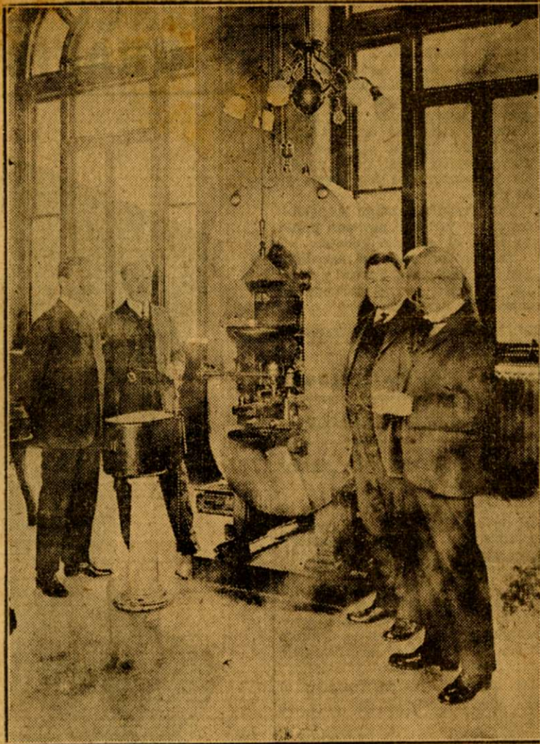
He aquí la prensa en que fué acuñada la primera moneda cubana.

lación monetaria de aquella fecha que oscilaba alrededor de 350 millones de pesos, lo cual daba más o menos una proporción de 3 por 100 entre ambas cantidades. Observando nuestros funcionarios de Hacienda que existía moneda fraccionaria americana en el país en cantidad estimada de unos $6.000.000,00, se acuñaron solamente $6.662.000,00 de monedas de plata, no obstante autorizar la mencionada Ley la acuñación de la misma hasta el límite o sea $12.000.000,00, seguramente para evitar que esta moneda traspasase los límites de las necesidades del mercado. Después, habiendo la circulación monetaria aumentado en