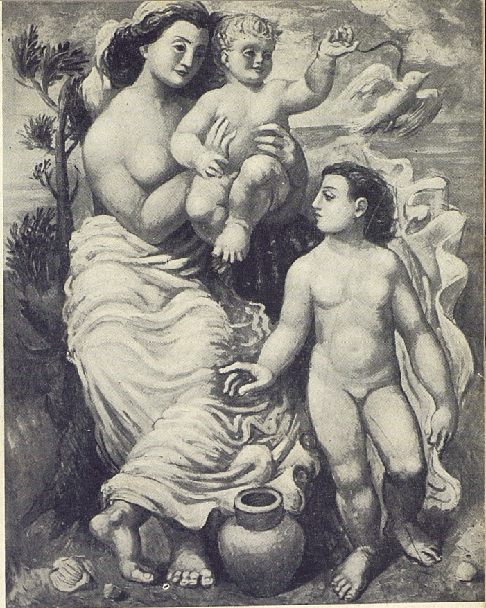
Mujeres cerca del mar, óleo

tribuye en mucho al engrandecimiento del patrimonio artístico francés.