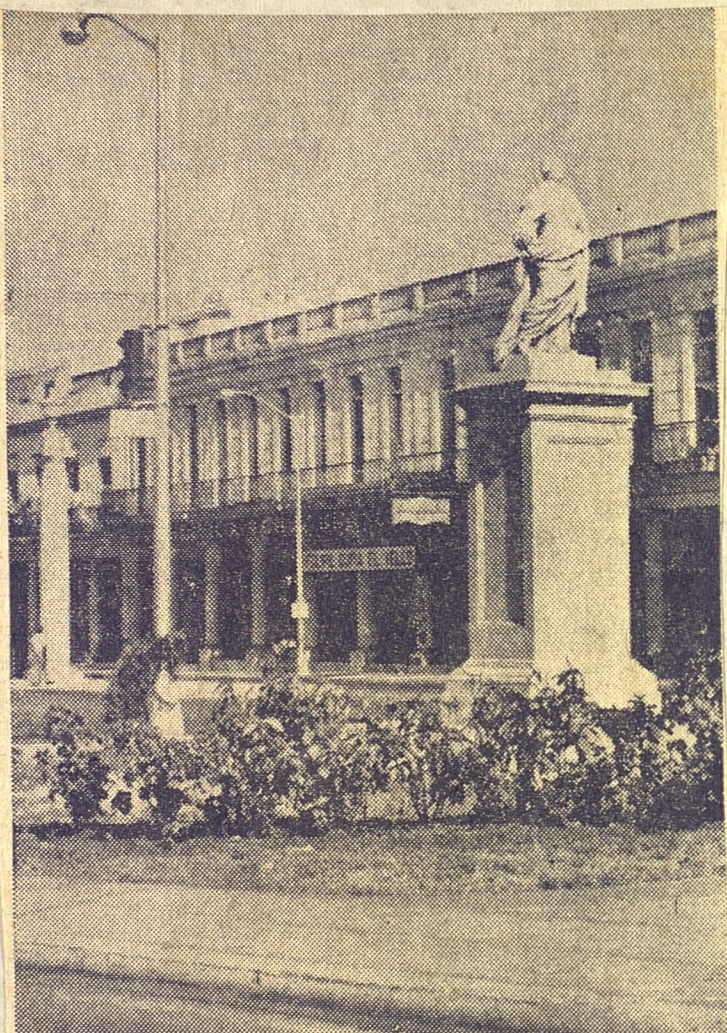
Estatua de Carlos III, erigida como homenaje del pueblo de La Habana—1803—“al buen rey” en el lugar que ahora ocupa la Fuente de la India. La trasladaron en 1840 al sitio donde ahora se encuentra, aproximadamente. La torpeza de los hombres más que el transcurso de los años ha deteriorado esa obra de arte—talla en mármol blanco—la mejor escultura de nuestra ciudad en aquella época. Dentro de poco tiempo le será restituída la verja de hierro que la circundaba. También ha reinstalado el MOP las dos columnas ornamentales, una de las cuales se ve a la izquierda de esta foto de Octavio de la Torre. Obsérvese que las copas de la parte superior de las columnas han tenido cuidadosa restauración.