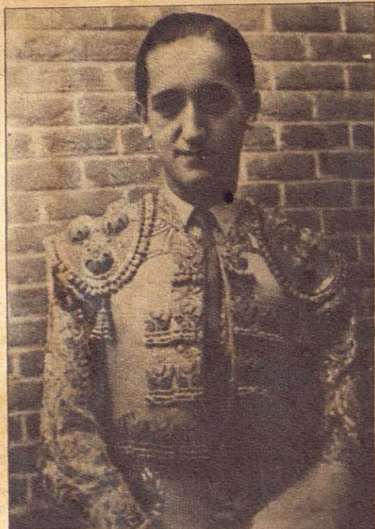
"Antofiete", también se ha plegado a las maniobras del "Clan" y figura como el quinto conjurado en la persecución que se hace objeto al torero Bienvenida.