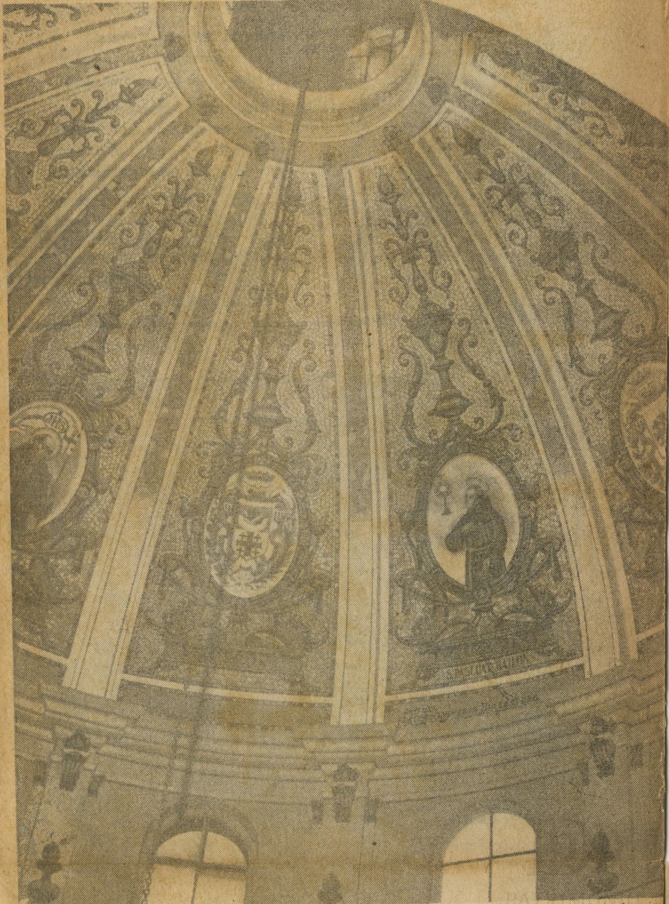
Con exquisito y severo gusto artístico, ha sido decorada interiormente la cúpula de la vetusta iglesia franciscana de Amargura. La fotografía muestra un aspecto parcial de dicha decoración. Se pueden apreciar, de izquierda a derecha, la imagen de San Bernardino de Siena, el Escudo de la Tercera Orden de San Francisco, la imagen de San Antonio de Padua, San Leonardo de Porto Maurizio, Beato Duns Scoto, y los Escudos de la Primera Orden Franciscana y de Su Sa...