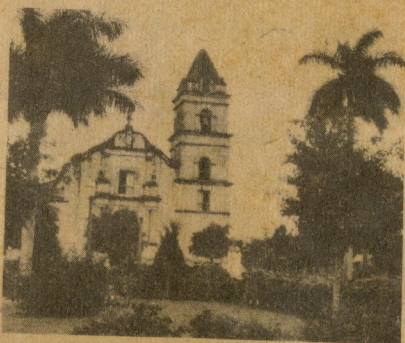
Iglesia de Santa María del Rosario.