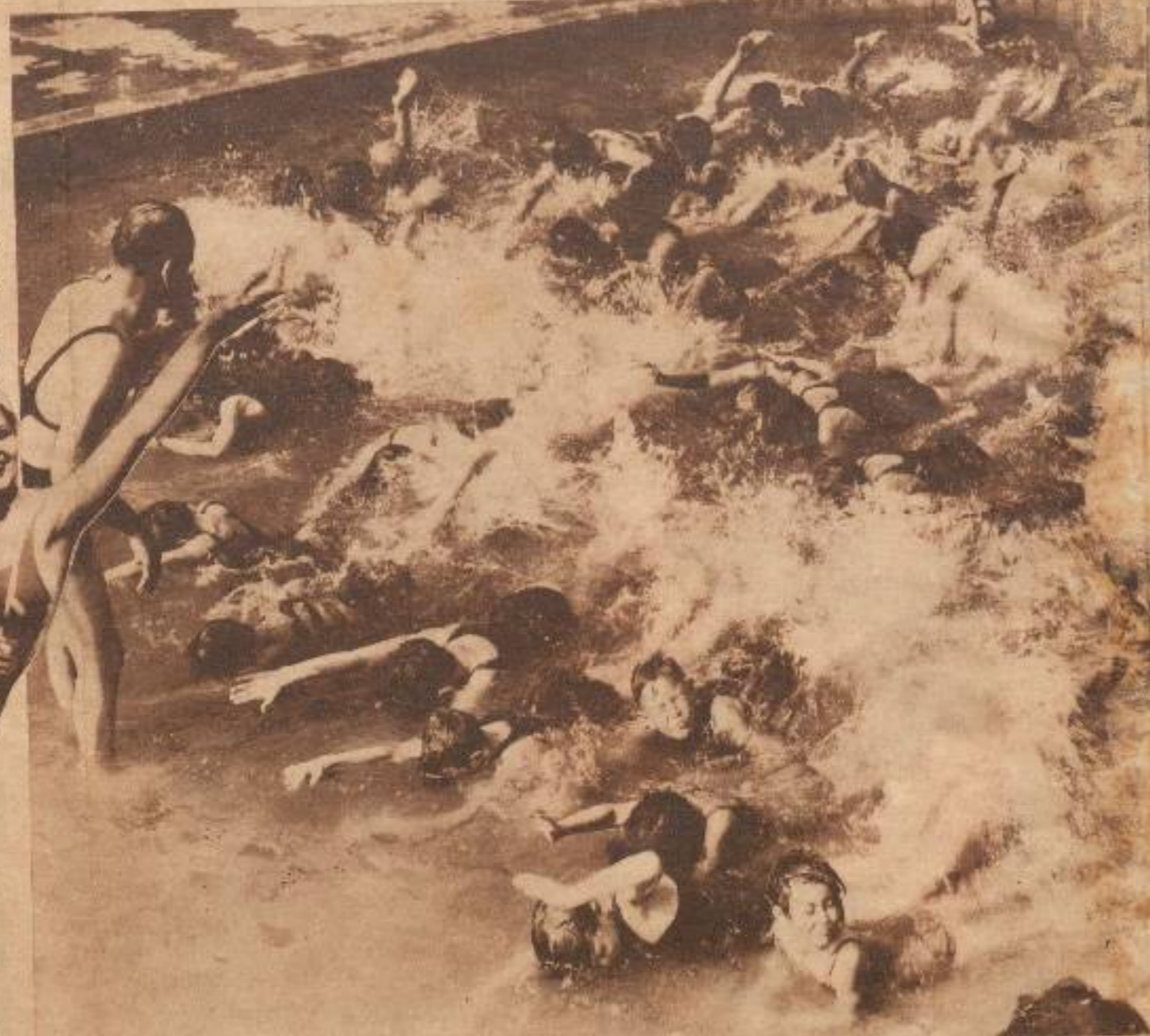
Lillian Bond, la maravillosa actriz de la M. G. M. cuando se encuentra en la playa, como de manifiesto sus cualidades artísticas de una manera evidente. En esta foto se puede apreciar un original aspecto de su cuerpo de diosa cubierto con una original y elegante trusa "Catalina"

Las arenas de la playa, se hicieron para ser pisadas por todo el mundo. Donde pisa la planta del pie una persona de rancia aristocracia, puede ponerla, al mismo tiempo, una de ascendencia plebeya, y una huella grabada en la arena por un banquero opulento, puede ser borrada inmediatamente por los pies de un criminal. En esta foto se puede apreciar al famoso pistolero norteamericano Jack Mc Guin ("Ametralladora"), tomando un baño de sol en una playa de la Florida en compañía de su "brida", la rubia Albia, mientras la policía norteamericana lo buscaba por todo el país