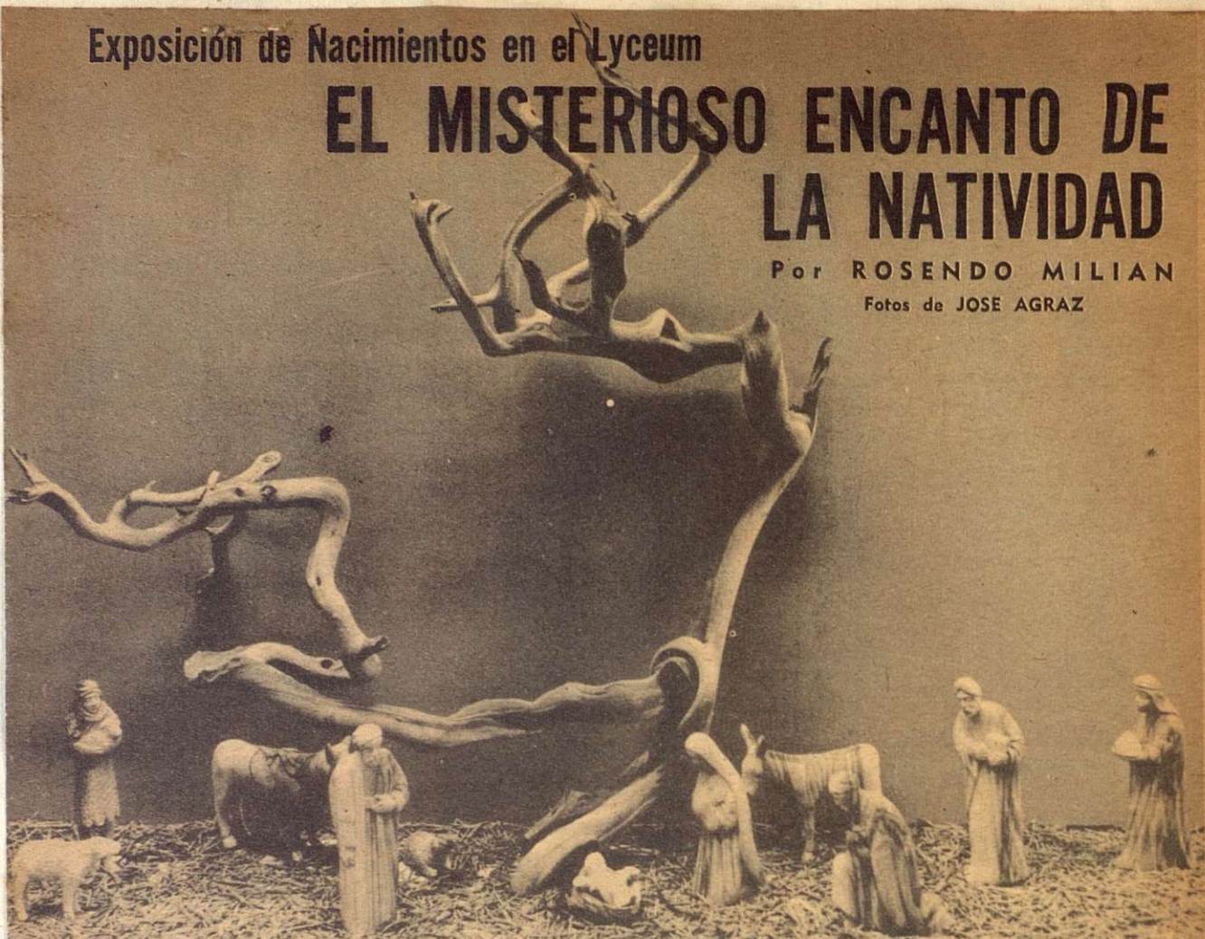
Hecho en Jerusalem, la tierra legendaria del Salvador, este nacimiento está tallado en madera de olivo. Tiene una atmósfera de melancólica tristeza.