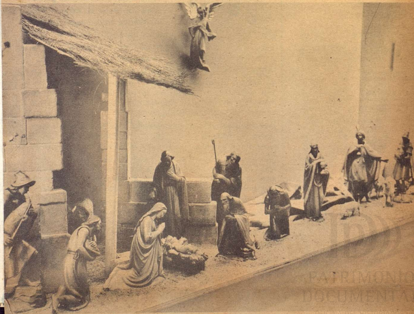
Estilo clásico, italiano. Talla en madera. Las figuras están terminadas. Este es uno de los mayores y mas hermosos Nacimientos del salón.

HEREDERO DE LA HISTORIA PATRIMONIO DOCUMENTAL DE LA NAVE HISTORIAS