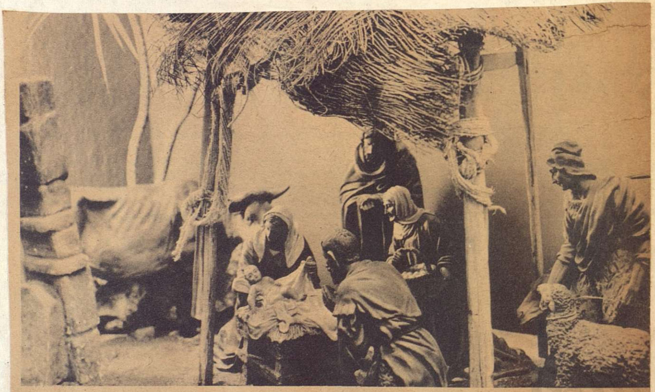
Modelado en barro, este Nacimiento copia al detalle un celebre cuadro de Murillo: "Adoración de los Pastores". Fue hecho en España, Barcelona, por los Hermanos Castells.

Llegaron al pesebre, entraron, se arrodillaron y abriendo sus alforjas cargadas de tesoros, ofrecieron dones al Hijo de Dios: el oro, el olíbano y la mirra que traían desde sus remotas tierras orientales.