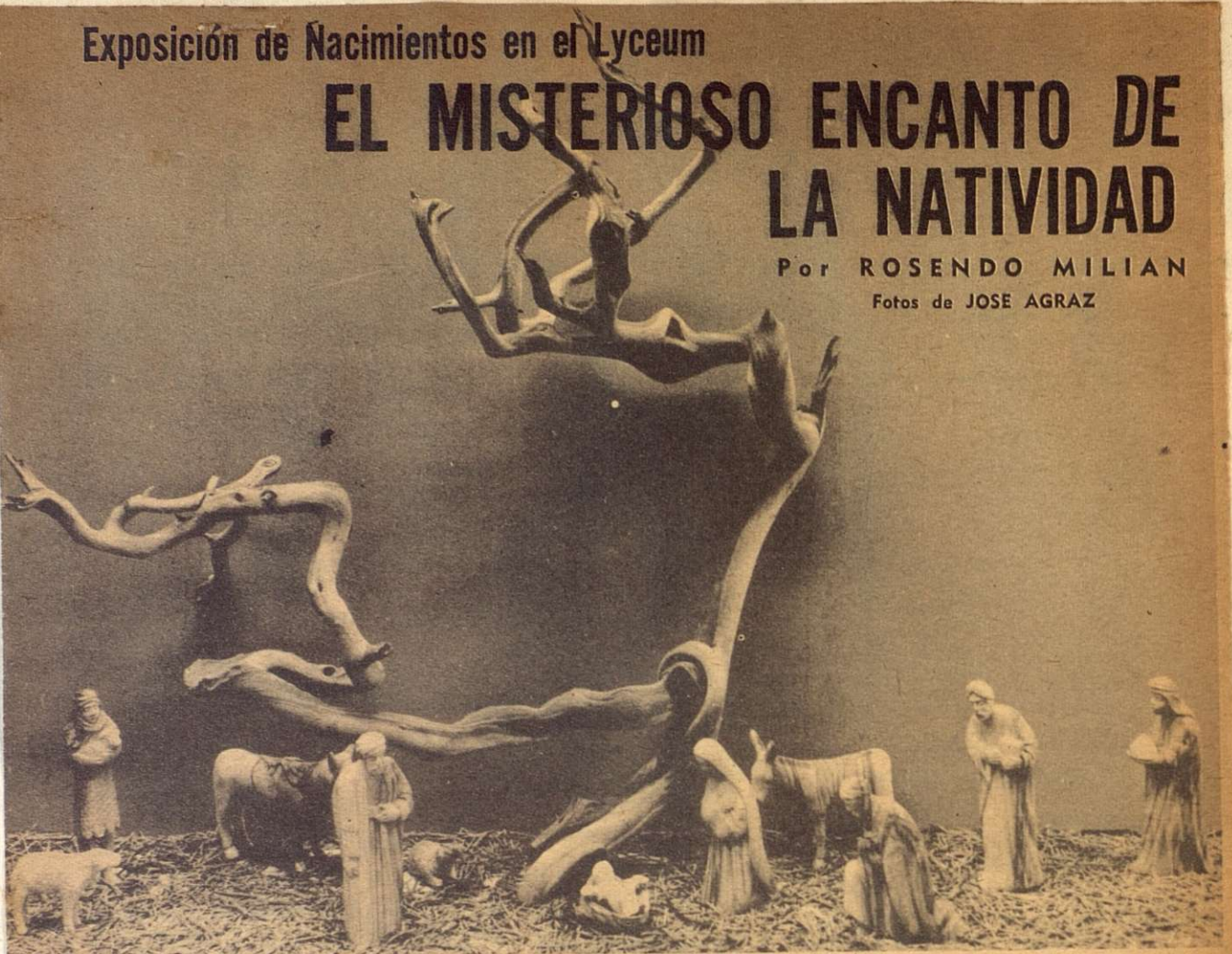
Hecho en Jerusalem, la tierra legendaria del Salvador, este nacimiento está tallado en madera de olivo. Tiene una atmósfera de melancólica tristeza.