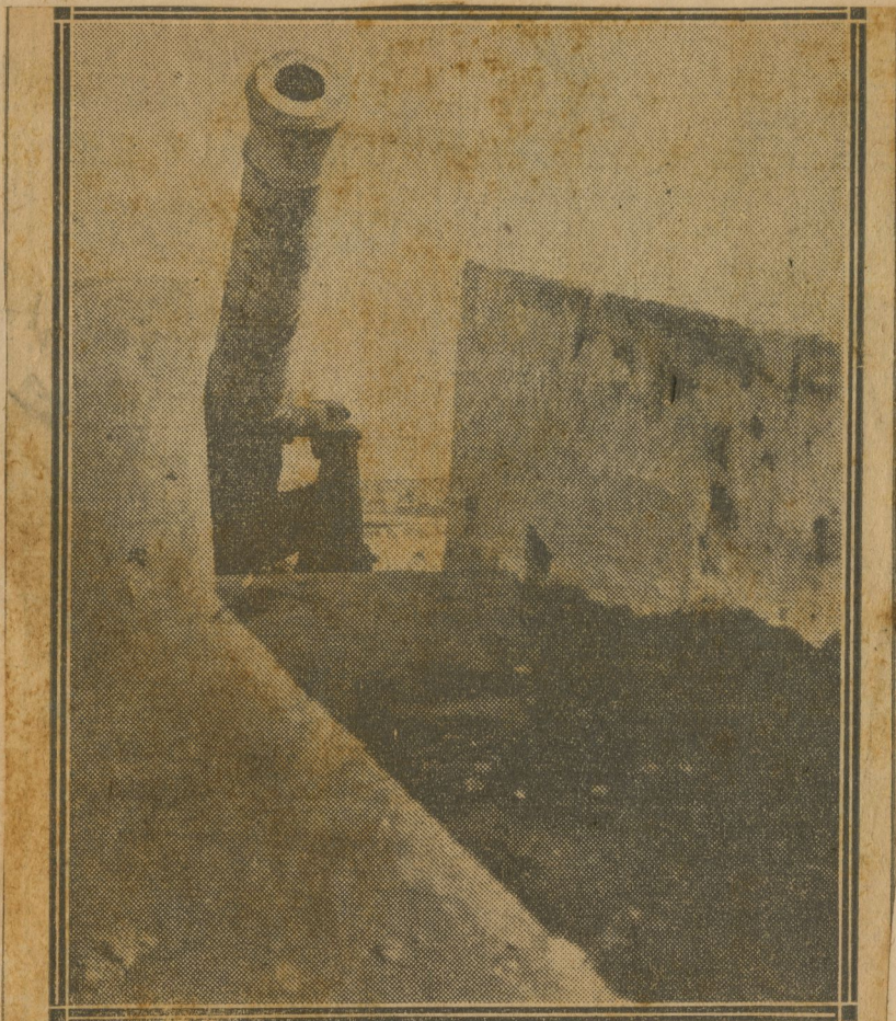
Aspecto del «Océano» (Pacífico) que hace el papel de estar defendiendo Atarés, no obstante tener una bala atragantada.

tro emplazamientos para cañones de grueso calibre en los ángulos, también de construcción española, aunque más reciente. Ese techo, donde han explotado granadas del crucero «Patria», sin penetrarlo, es ahora una peligrosa criba, a causa de los lucernarios contruidos en tiempo de Wood. Y si les parece mejor, figúrense un paraguas, lleno de agujeros del tamaño de dos pesetas, para tener una idea aproximada de lo que