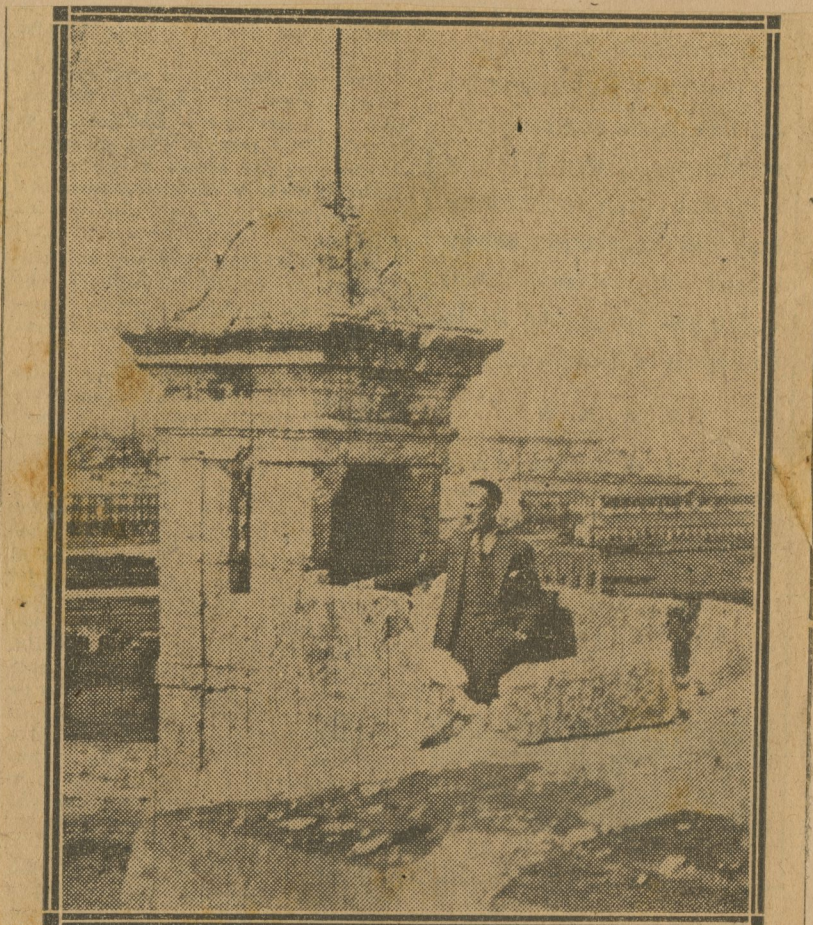
Arañazos en la piel de un elefante. A eso equivalen las huellas de las granadas en el Castillo de Atarés.