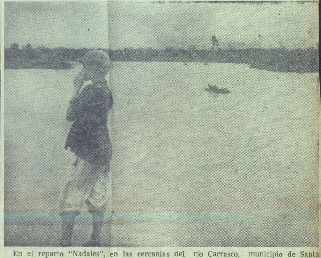
En el reparto "Nadales", en las cercanías del río Carrasco, municipio de Santa Cruz del Sur, un niño contempla la crecida del río y mira hacia el lugar donde se levantaba su vivienda hasta unas horas antes. Ahora está bajo el agua.