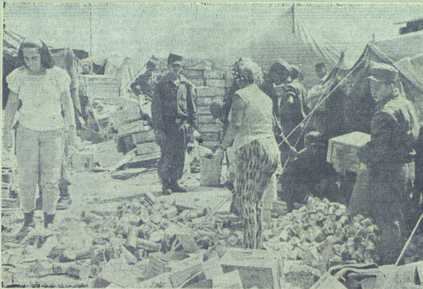
La presidenta de la Federación de Mujeres Cubanas, Vilma Espín, en unión de miembros del Ejército Rebelde y de la FMC, cuando trabajaba en el aeropuerto de Holguín en la distribución de alimentos y medicinas para las zonas afectadas.