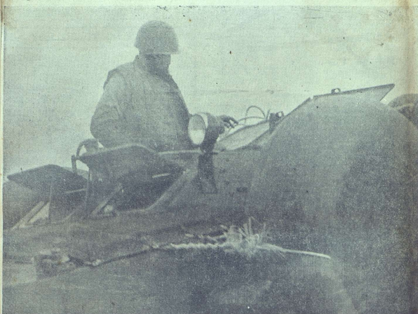
El Primer Ministro del Gobierno Revolucionario, comandante Fidel Castro, a bordo de una tanqueta anfibia, cuando se disponía a iniciar el plan de evacuación y rescate que personalmente está dirigiendo en las zonas inundadas por el desbordamiento del río Cauto.