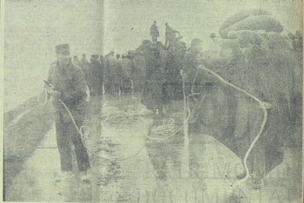
Sobre la carretera que va a Bayamo, en el lugar conocido por El Naranjal, flanqueados por corrientes de aguas desbordadas, se iniciaron los preparativos para llevar adelante el rescate de damnificados de la zona del río Cauto. Sogas, salvavidas, tanquetas anfibias, botes, alimentos, medicinas, etc., fueron transportadas para auxiliar a los campesinos.