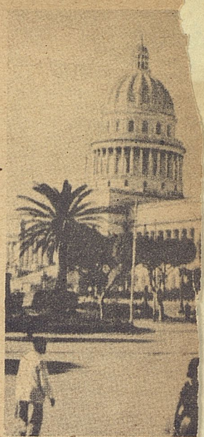
A través del Parque Central se ve el Capitolio, terminado en 1929 en una imitación de la costosa del Capitolio de Washington.