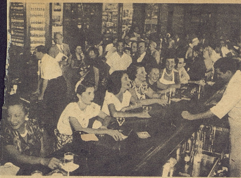
El bar "Sloppy Joe's", uno de los más conocidos de La Habana, debe su nombre a un director de periódico que lo denunció en letra impresa después que el propietario rehusó hacerle un préstamo.