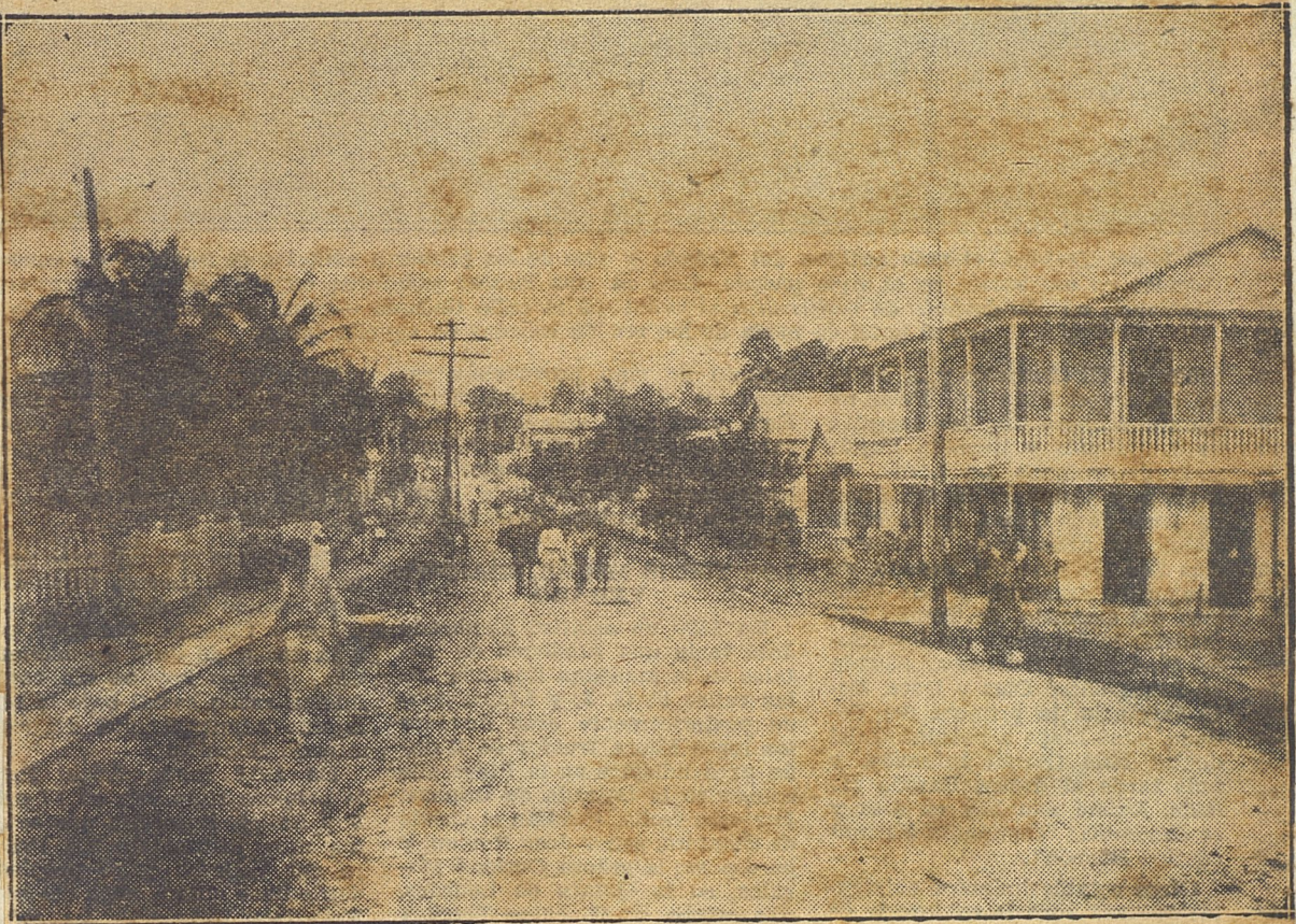
LA CALLE DE LA LINEA DEL VEDADO. — La calle 9, primera en trazarse, pues seguía las paralelas del primer sistema de comunicaciones de la vieja ciudad con el Barrio del Carmelo. Esta vista fué tomada hace cuarenta años, cerca del Paradero del Carmelo, en las márgenes del Almendares.

6.-El programa de los cubanos siempre hab