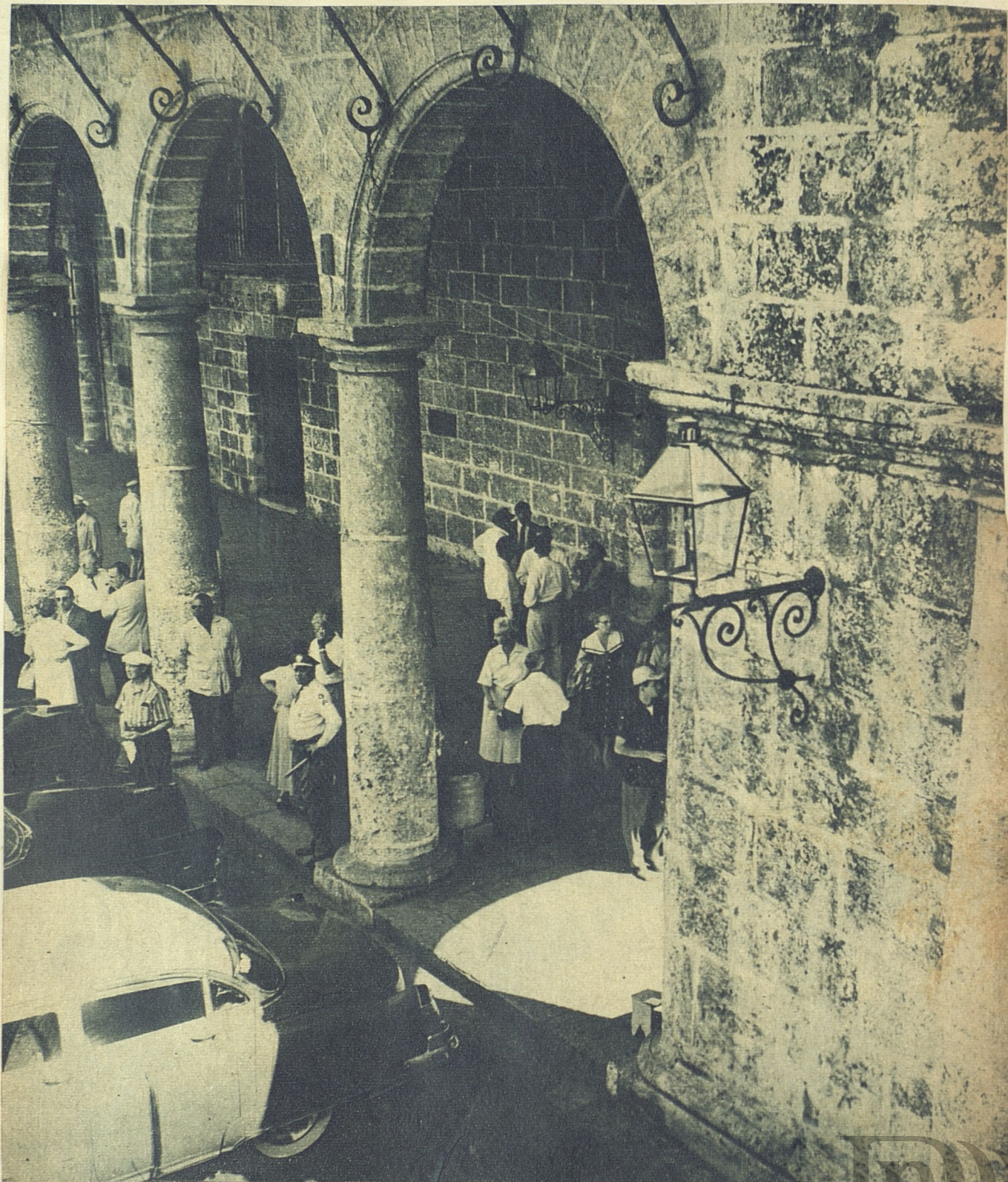
La antigua Habana no es sólo curiosidad para turistas. Hay que asomarse a ella con sensibilidad, cultura y amor.