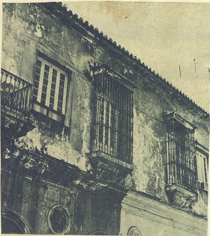
Una Habana de rejas y balconadas en la que los nobles materiales del hierro y la piedra se espiritualizan con una perenne vocación de eternidad.