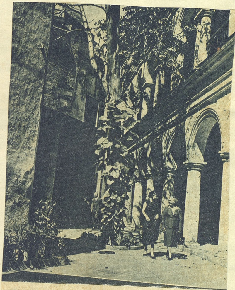
Una Habana silente y recoleta, donde la arquitectura vegetal del árbol juega con la pétrea arquitectura del arco y la columna.