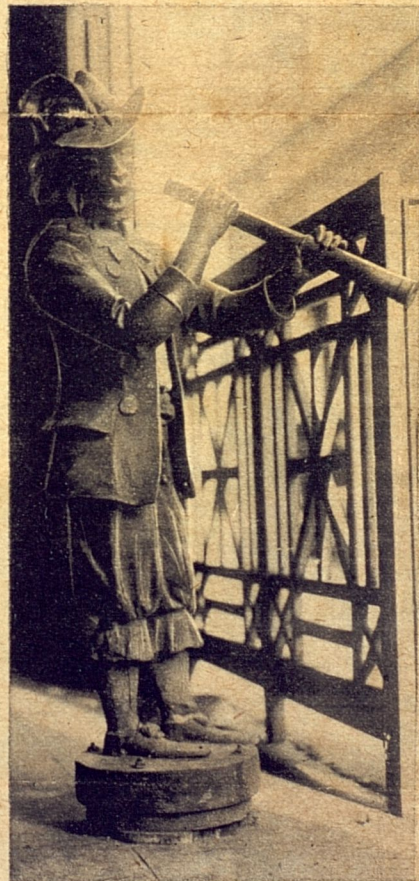
Este es el portero del Potro Andaluz. Lleva sesenta años desempeñando el oficio en esta casa de la calle Teniente Rey y le quedan fuerzas para seguir desempeñándolo otros 60 años más