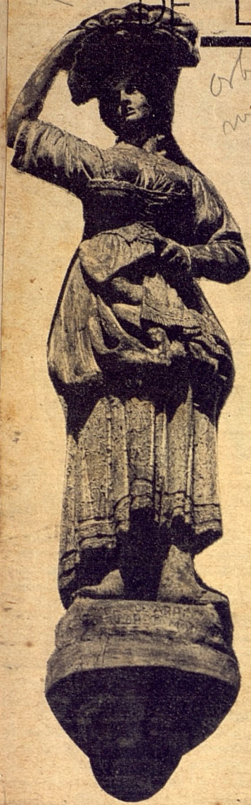
"Vendedora de Frutas de la Casa de las Figuras"