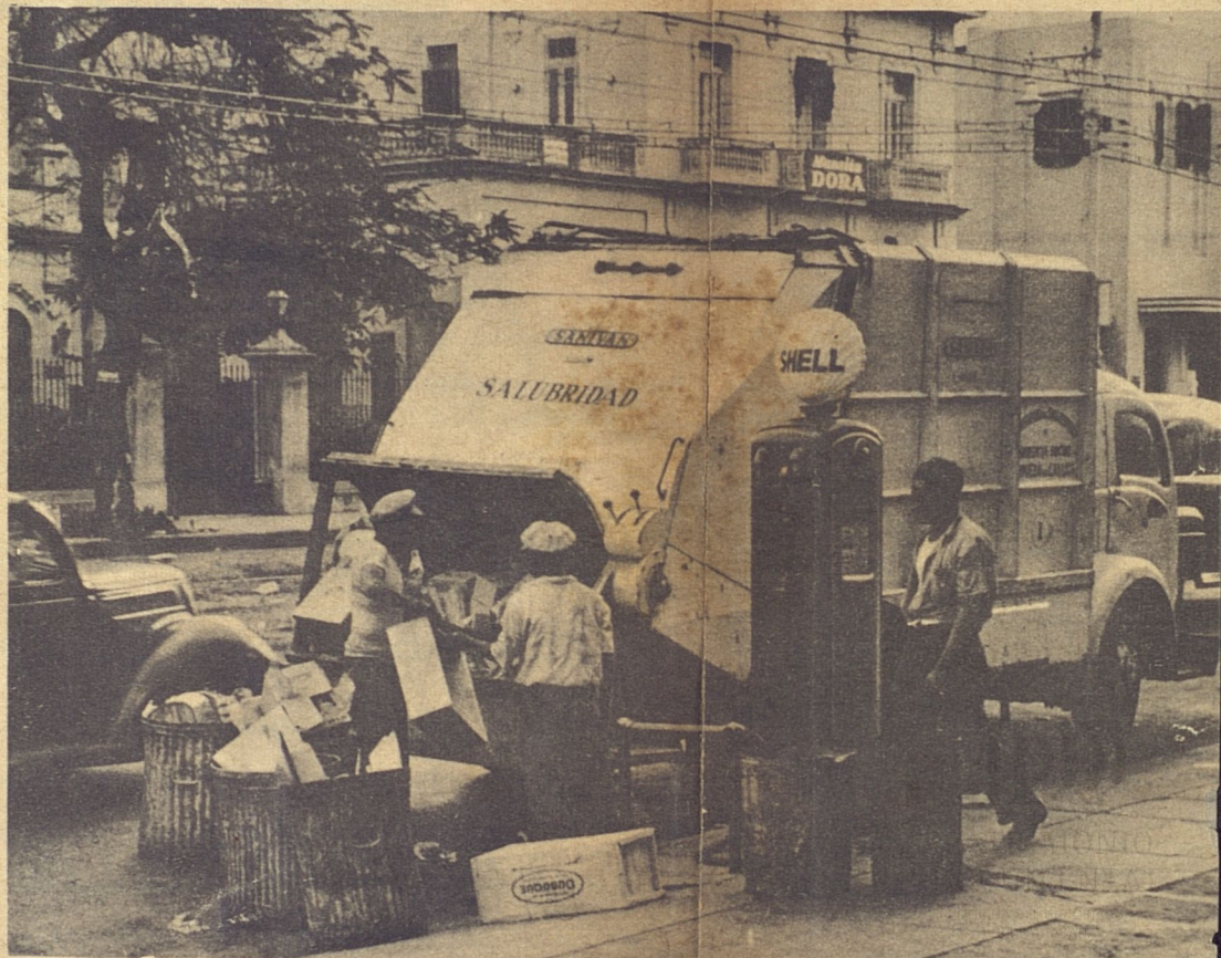
Otro camión de Salubridad, recogiendo basura de día en una calle céntrica de la ciudad.