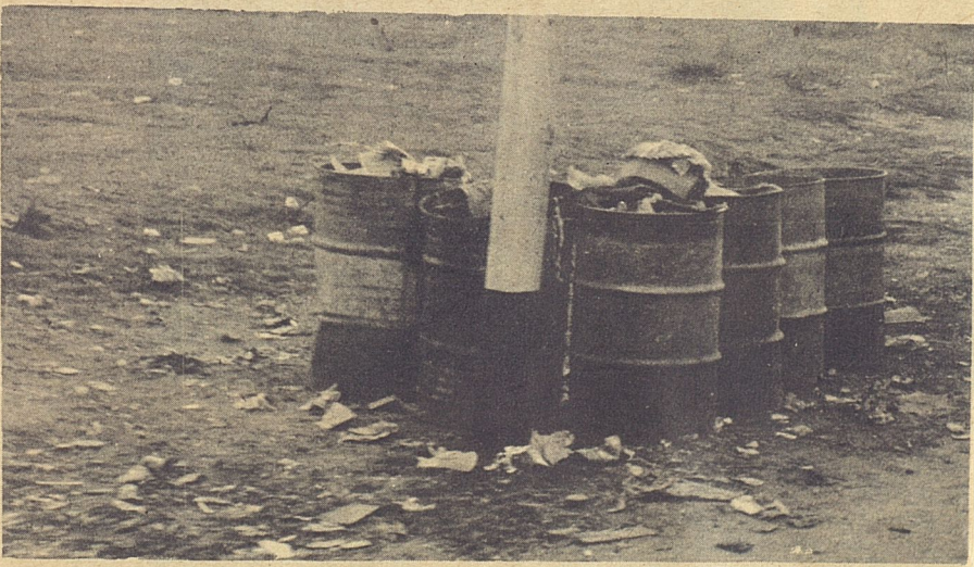
Más depósitos de basura, esto es, en Octava entre Pocito y A, a la espera del paso del camión de la basura... una espera de días.