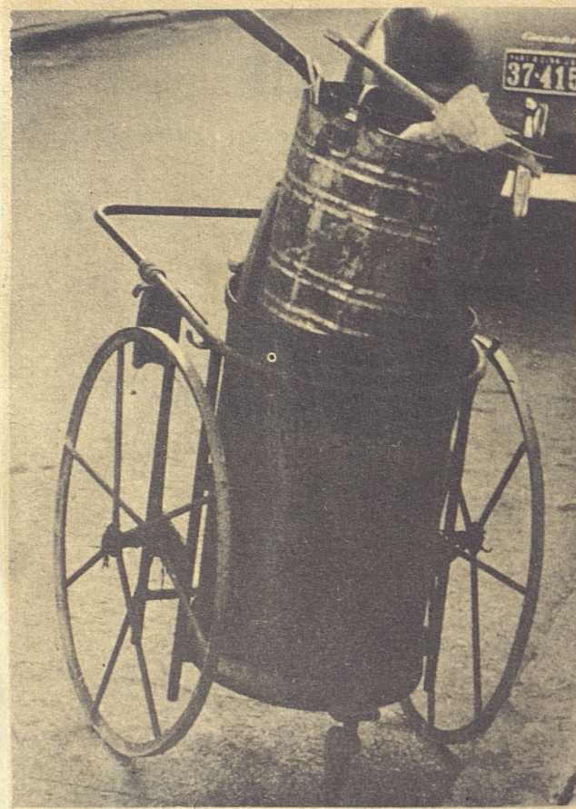
Una carretilla abunonada, quizás porque el encargado de manipularla piensa que puede quedarse donde está, como los latones de basura que hacen centinela a la puerta de las casas.