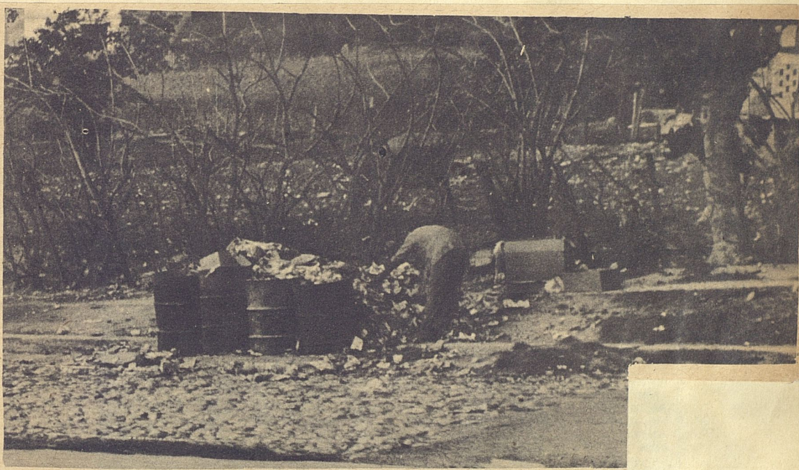
Este es otro de los muchos basureros improvisados que pueden verse en los suburbios de La Habana.