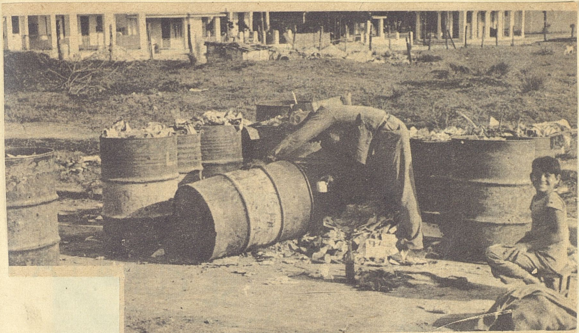
Aquí, en 17 y 18, la cosa es peor: los depósitos de basura permanecen días y días, sin que el servicio de limpieza de calles envíe por allí sus camiones.