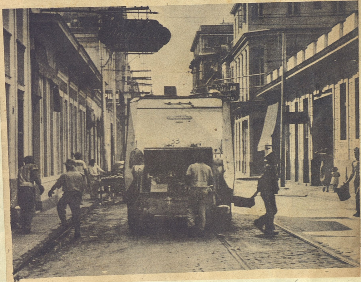
En San Francisco y Concordia, como si dijéramos en el centro de La Habana, este camión de Salubridad recoge la basura a plena luz del día.

Creemos que el Ministro de Salubridad, un médico, sea de la misma opinión. ¿Por qué, entonces, no pone remedio al mal? Si es que le faltan recursos para que el servicio de recogida de basuras se haga de noche en todas las secciones de la ciudad, debe, está en la obligación de reclamarlos, y nosotros seríamos los primeros en acompañarle en esa demanda. Todo, menos callar y hacerse cómplice de un estado de cosas que deteriora moralmente su nombre de profesional de la Medicina. Una política de salubridad e higiene, una buena política, debe empezar por ahí. ¿No estamos, precisamente, en presencia de un peligro de contagio epidémico? Pues no vemos el modo de evitarlo eficazmente, si se abandona la más elemental de las precauciones: la limpieza de calles y plazas y la recogida de basuras antes de que el calor las descomponga y el viento arroje, sobre los setecientos mil habaneros, sus millones de bacterias.