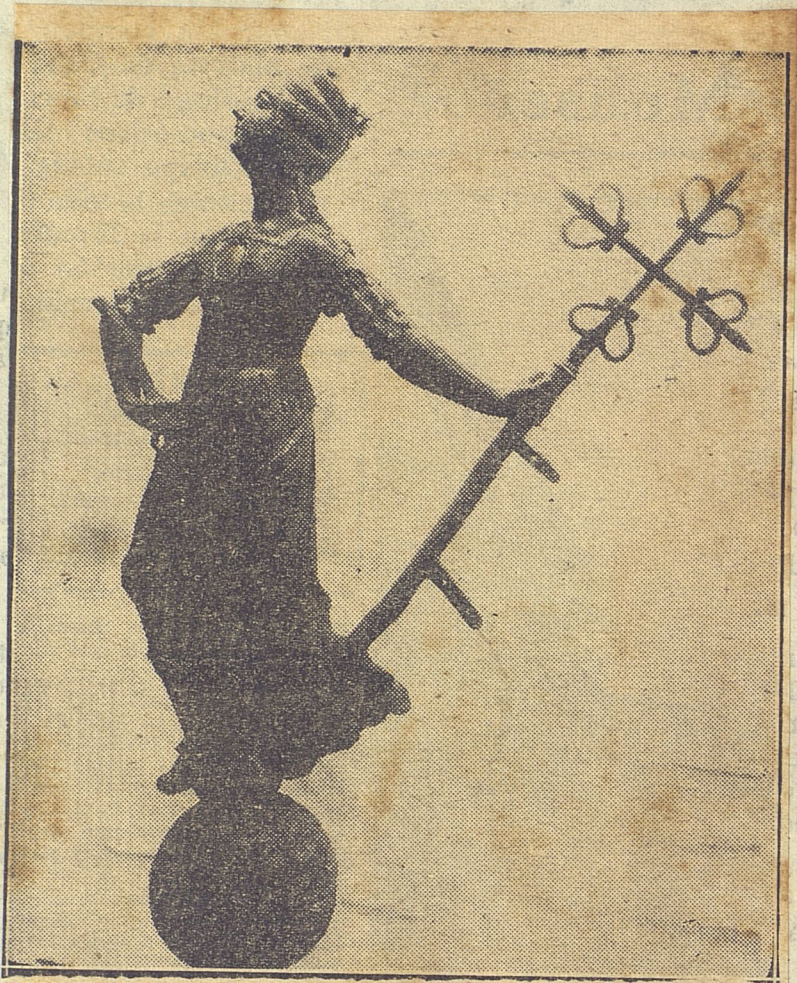
La primera estatua de La Habana que aun hoy día luce en la cúpula de una torrecilla del Castillo de la Fuerza.