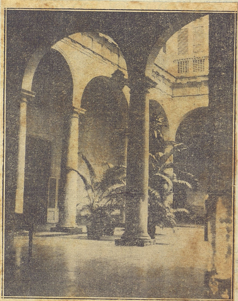
Patio del antiguo edificio en que hoy está instalado el Tribunal Supremo de Justicia.

Trasladamos al actual Ministro de O. P. la importante petición, con el ruego de su inmediato cumplimiento.