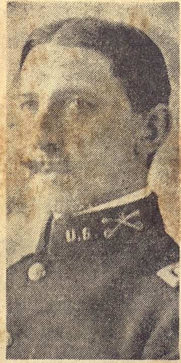
El teniente Mathew Hanna que desempeñó durante el gobierno del general Wood el cargo de Comisionado General de Escuelas, con muy amplias facultades para dirigir la enseñanza primaria desde el punto de vista administrativo.