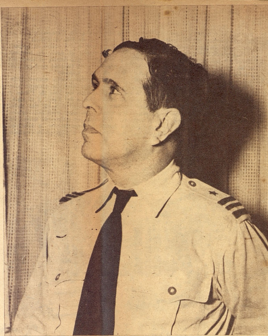
El comandante José Carlos Millás, Director del Observatorio Nacional.

Observatorio de Belén, septiembre 19, 2 p. m.—Durante la mañana la perturbación ciclónica del Caribe ha aumentado algo en intensidad alcanzando ya fuerza de huracán moderado. En cambio su traslación sigue siendo muy lenta y todavía en dirección al Oeste Noroeste. A las dos de la tarde se encuentra aproximadamente a los 19 grados y medio de latitud y 82 de longitud, a unas cuarenta millas al Oeste de Gran Caimán. Su movimiento de traslación, continúa siendo hacia el Oeste Noroeste en dirección al canal de Yucatán, con una velocidad de unas cinco a seis millas por hora. Los vientos centrales han aumentado ya a 85 millas por hora en una pequeña zona cerca del centro. En Gran Caimán se registraron, por la mañana, vientos de 75 millas por hora, habiendo bajado el barómetro a 748 milímetros con fuertes aguaceros. Para La Habana no existe peligro por ahora ni tampoco inmediato para Pinar del Río. La marcha futura no está todavía muy definida y segura y por lo mismo es necesario mantenerse sobre aviso, especialmente la navegación por el Caribe septentrional, Canal de Yucatán y zonas inmediatas del Golfo, por donde continúa siendo peligrosa. Estas son las últimas noticias recibidas de las observaciones