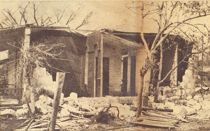
Destrozos causados por el huracán en el pueblo de Bolondrón.

El Observatorio del Colegio de Belén emitió su cuarto boletín a las ocho y media de la mañana de ese día lunes 20. El mismo decía: "El ciclón del Caribe sigue avanzando con lentitud casi hacia el Norte y aproximándose a la Isla de Pinos. A esta hora se halla aproximadamente a los 21 grados de latitud y 82 y medio de longitud a unas cuarenta millas al Sursudeste de la Isla de Pinos y a unas 120 millas de nuestra costa Sur. La dirección de su traslación ha ido inclinándose cada vez más al Norte siendo actualmente al Nornoroeste con tendencia a inclinarse más al Norte y su velocidad de traslación