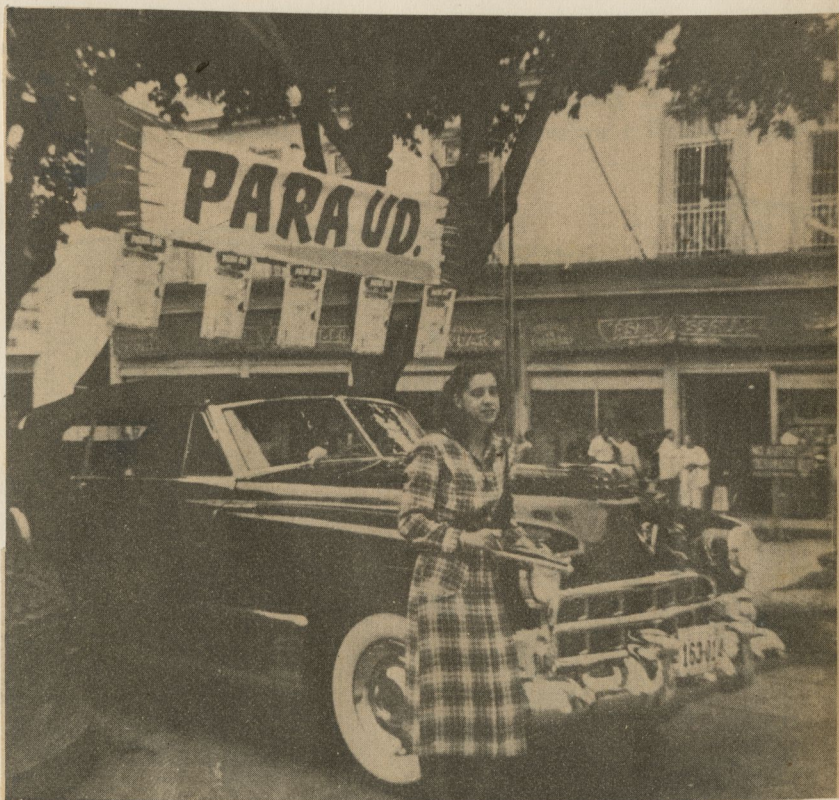
"Por un peso puede ser suyo" invita le joven señalando el auto y ofreciendo al transeúnte una "suscripción". Para el cubano promedio la tentación es fuerte, porque la posesión de un "cola de pato" constituye casi el anhelo máximo de los jóvenes de la actual generación. Pocos son los que aceptan, pero los que rehusan no pueden evitar que durante muchos minutos su mente siga barajando la oportunidad de "manejar máquina propia".