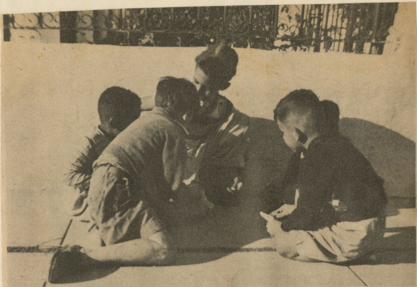
Son niños de los repartos, de familias modestas pero decentes. Las postales que utilizan son detonantes policromías que exponen las aventuras episódicas de la radio para ocultar la ofrecida tentación de juguetes a los coleccionistas. El esfuerzo, sin embargo, resulta grande para la impaciencia infantil que, en lugar de coleccionarlas, las utiliza a la vez de barajas y fichas en un juego que denominan vagamente "la banca". Ganar y perder es aquí una emoción sana, casi pura.