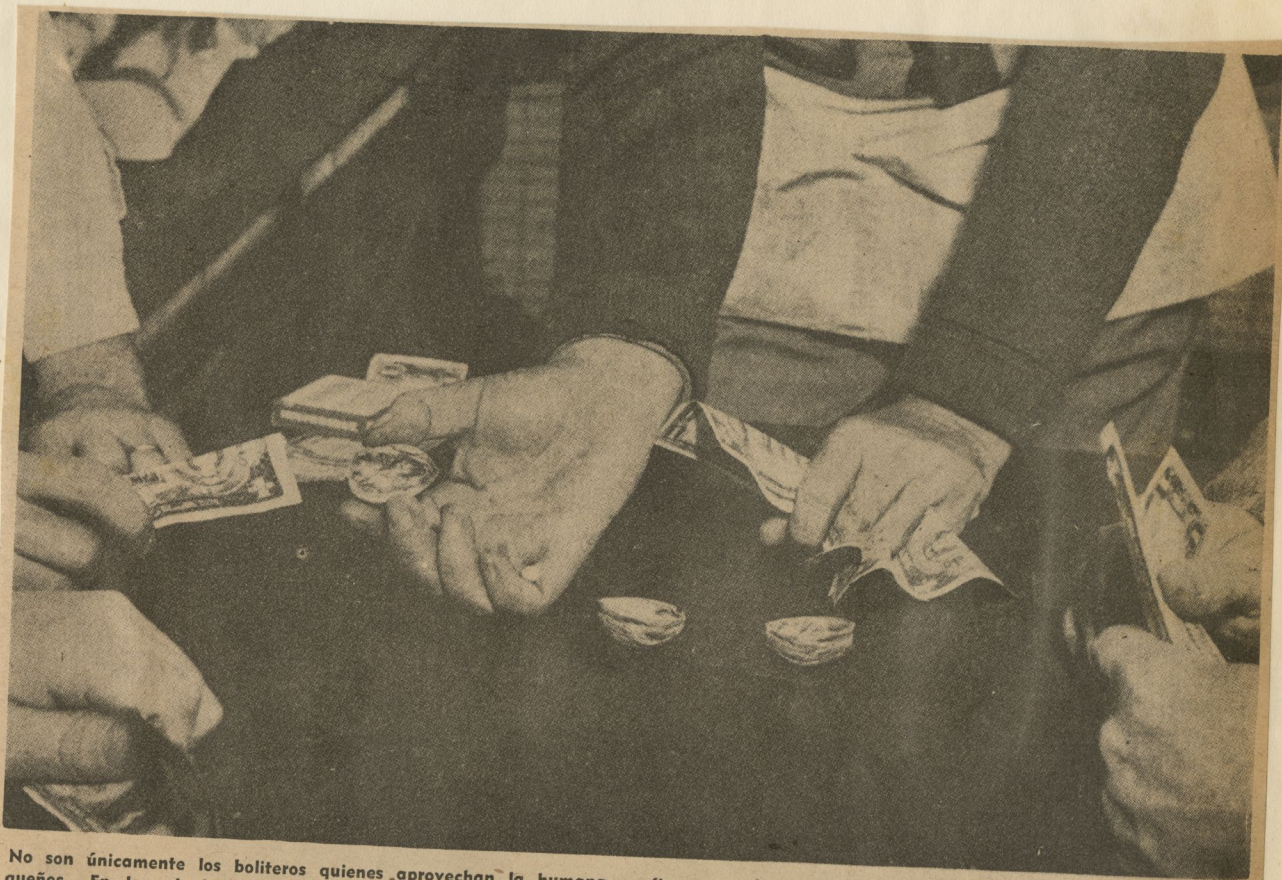
No son únicamente los boliteros quienes aprovechan la humana confianza en la suerte para resolver los problemas grandes y pequeños. En los alrededores de los hipódromos, campos de pelota, parques de diversiones, y en todo lugar en que el pueblo se reúne en busca de solaz, se dan cita los profesionales del juego con ventaja, los practicantes del truco de las tres tapitas en sus múltiples variedades que se adaptan a los distintos medios y utilizan indistintamente tres tapas de laguer que igual número de cáscaras de nuez. La organización está compuesta por el hombre de las manos ágiles, los "palas" y el espectador ingenuo que descubre de pronto estar en posesión de una vista de águila... ¡hasta que apuesta!